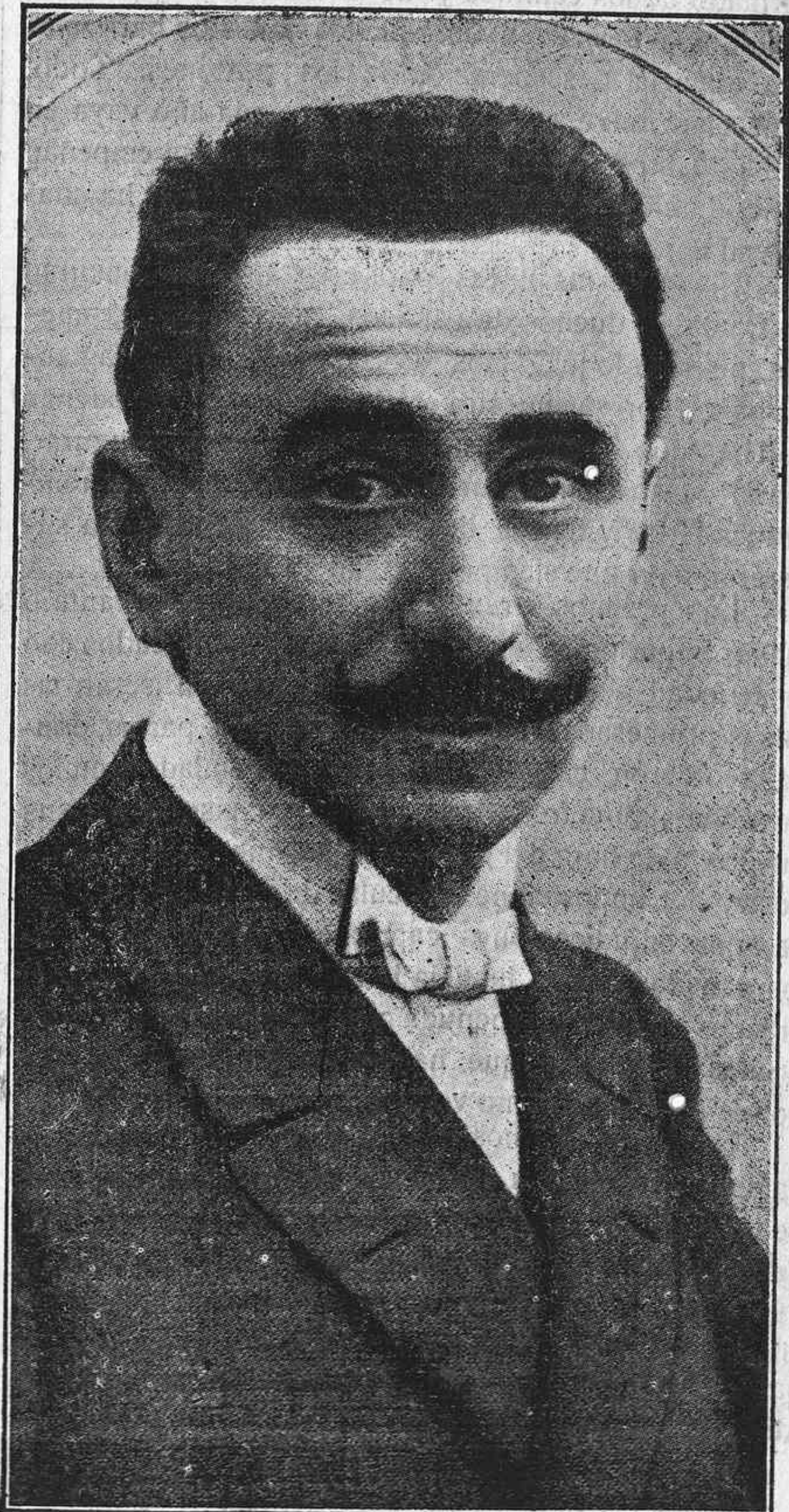
D. Melquiades Alvarez