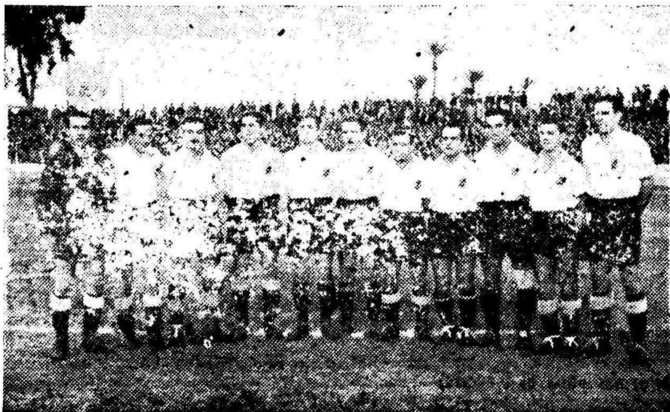
Equipo del Constancia, que resultó vencedor en la tarde de ayer

La amplia derrota encajada en su viaje a La Condomina por el equipo isleño, había hecho que los ánimos de sus seguidores se encontraran predispuestos contra el Real Murcia, máxime teniendo en cuenta que a raíz de aquella, el Constancia ha ido deshaciendo la labor magnífica de la primera vuelta para ponerse en trance de no promocionar siquiera, pareciendo, como se desprende de sus primeras actuaciones que iba a ser uno de los equipos que lograrían el ascenso automático.