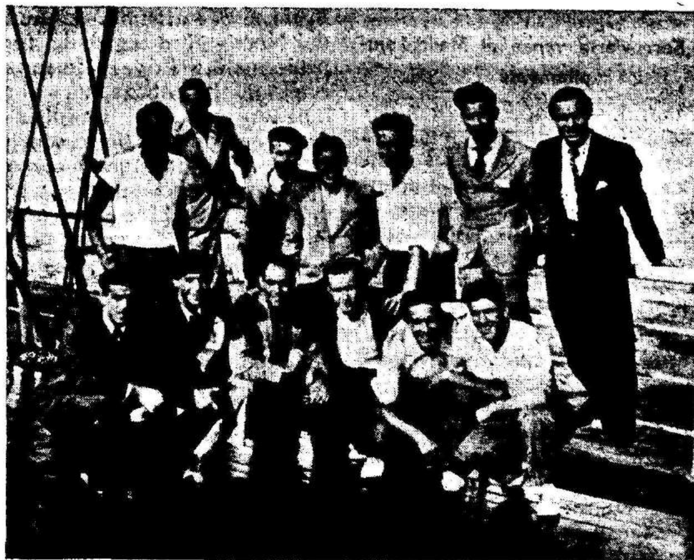
Los expedicionarios murcianos a bordo del «Laferrriere» en la travesía a Orán. —En la foto solo falta Sornichero, que indudablemente es su autor.

También en esta segunda parte el sueco S. Eckling, por lo visto convencido de que ya no hacían falta sus arbitrariedades, ha moderado, como los jugadores italianos, en sus excesos, dejando al equipo ya derrotado que se