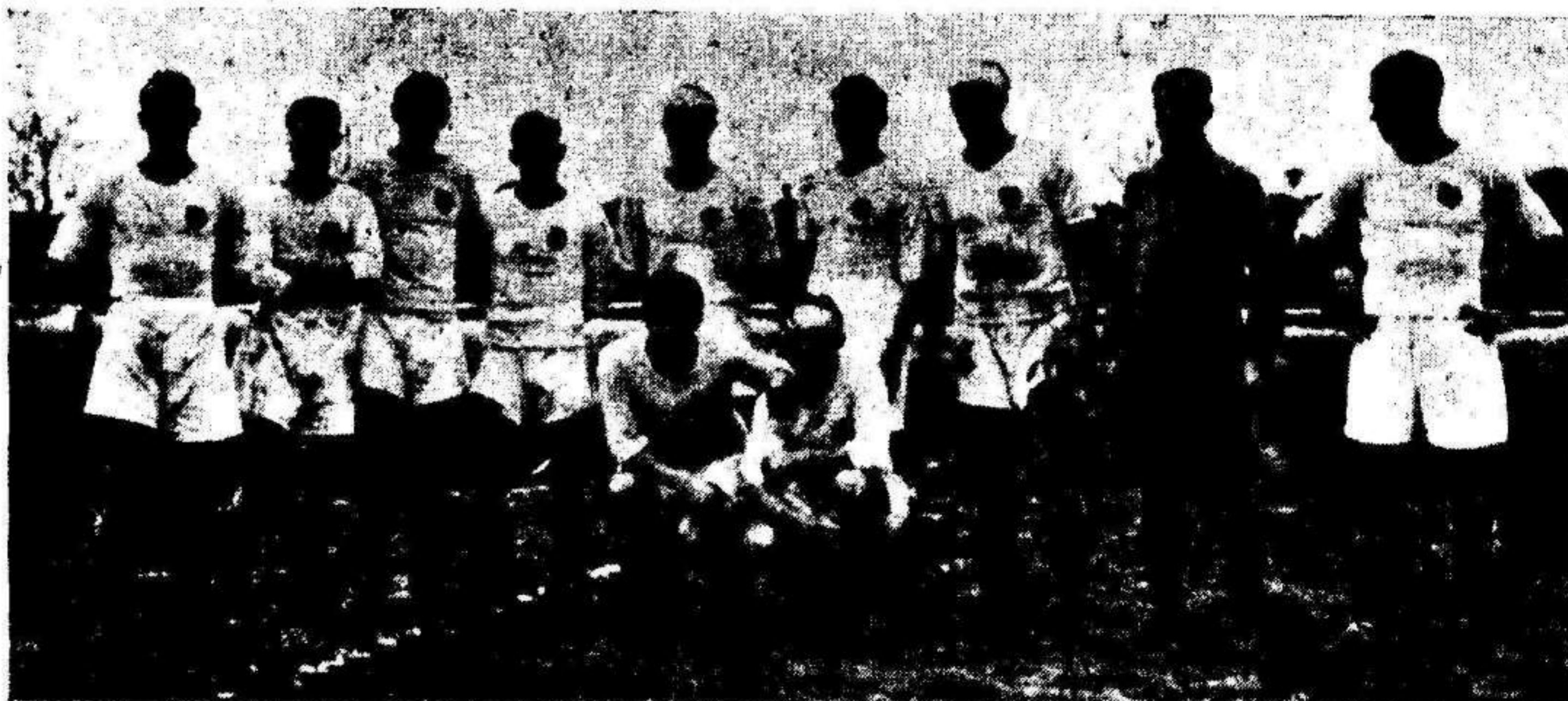
Equipo del Valencia F. C. que venció al Murcia.