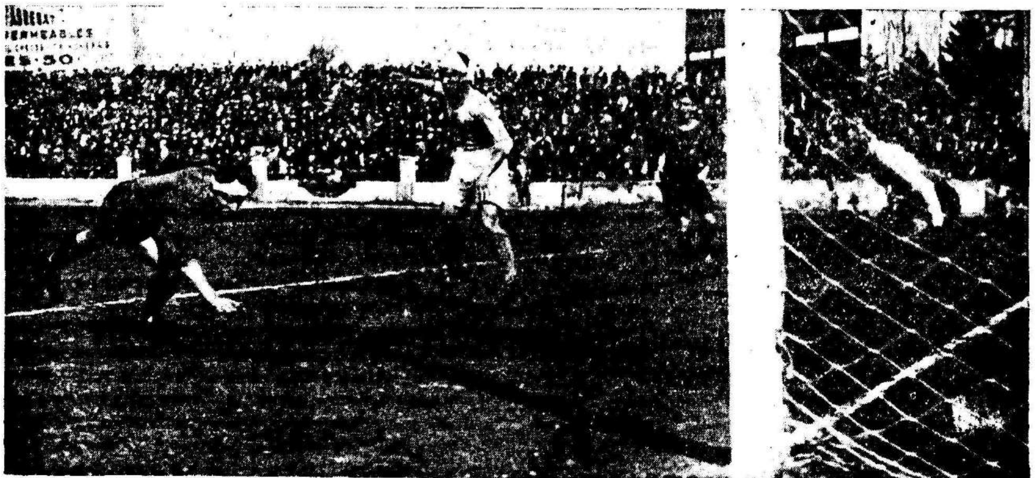
Zamoreta en un espectacular remate de cabeza que salió a kick.