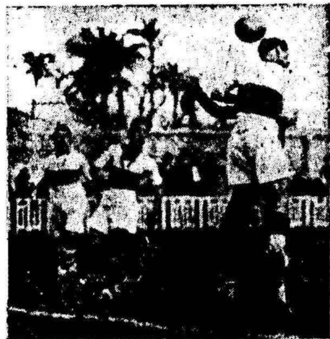
La defensa del Elche corta, no muy limpiamente un avance del Imperial. F. Arenas

do, se filtra por entre las defensas, y «fusila» el tanto imparable.