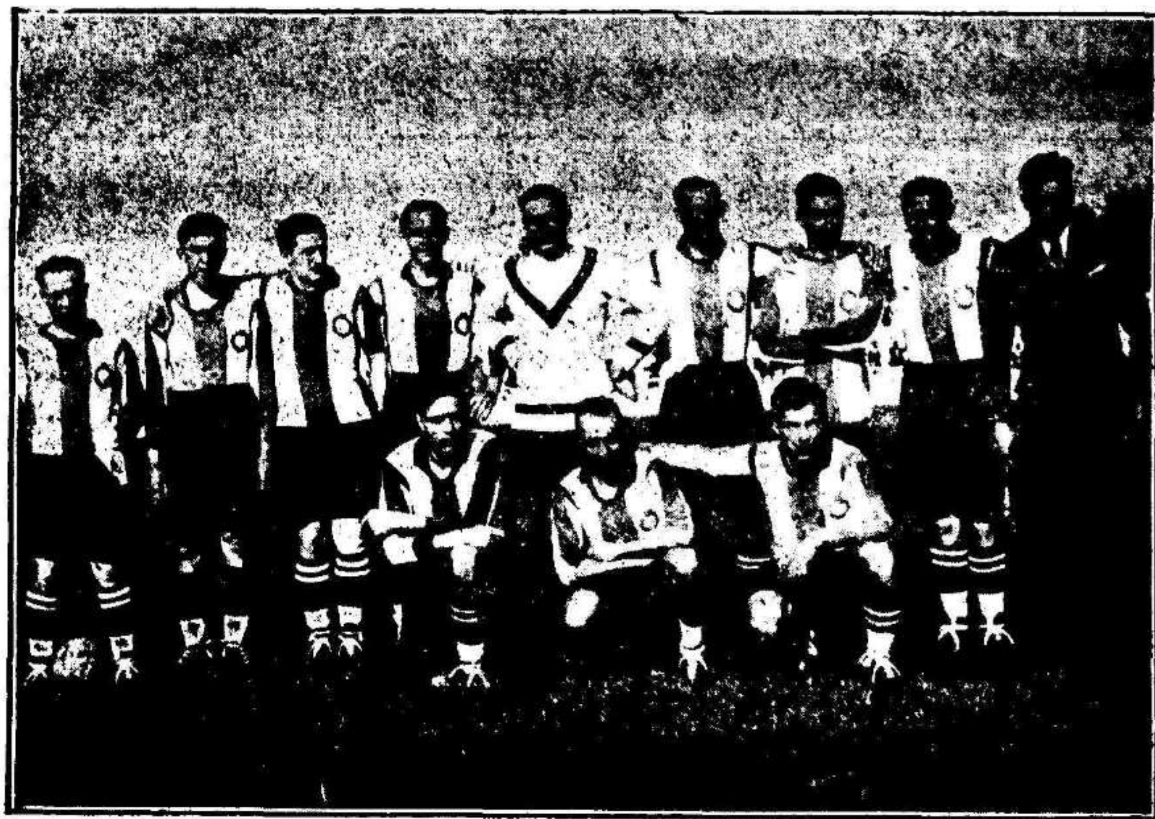
El Español de Barcelona, que tan brillantemente va a la cabeza del campeonato catalán, sin que la puerta de Zamora haya sido batida