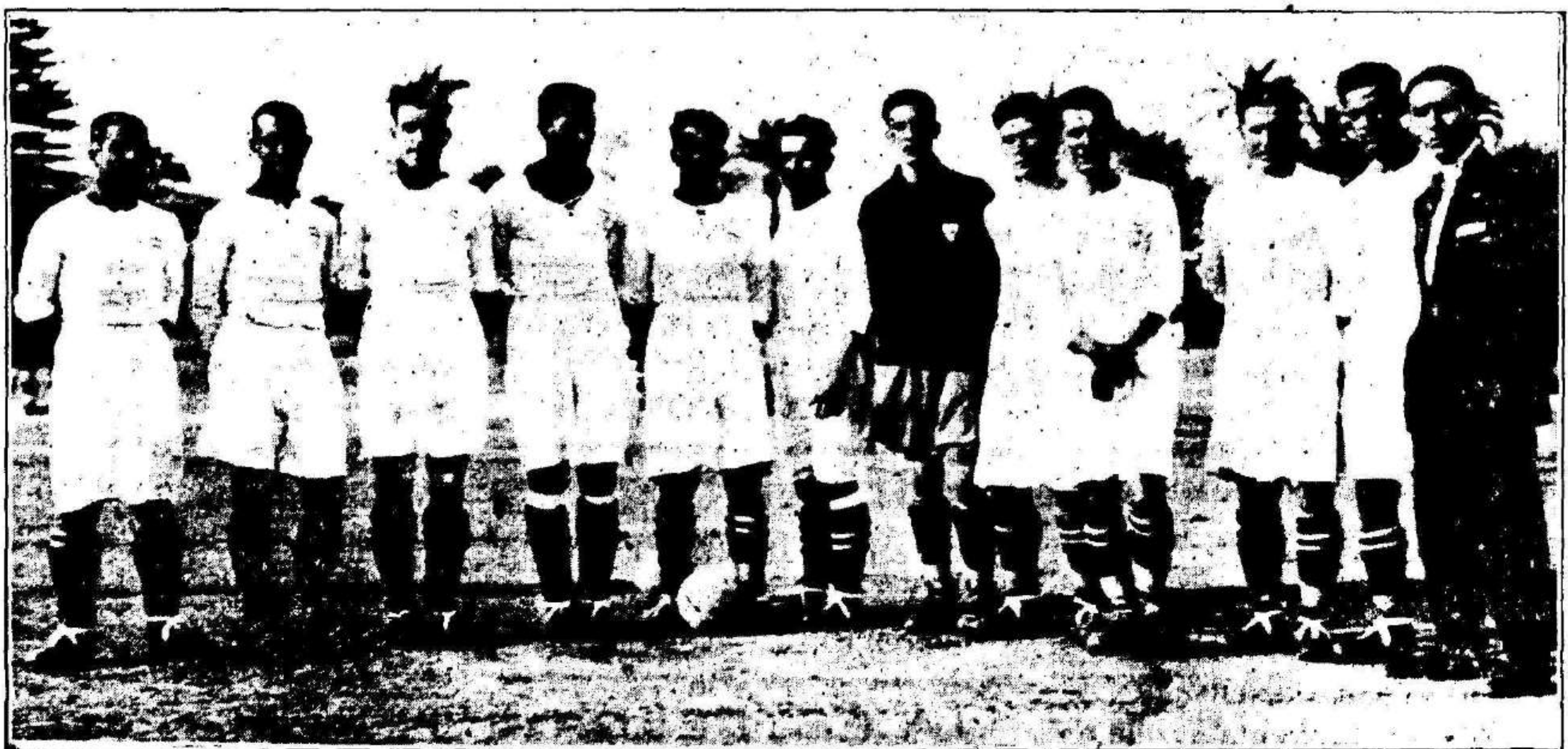
El entusiasta equipo del Sevilla F. C.

Lo inesperado de la jugada dejó a todo el mundo aplanado y cuando el equipo realista quiso reaccionar era tarde, los sevillanos más viejos en estas lides, se preocuparon principalmente de asegurar el empate y lo consiguieron. Todavía tiraron los realistas un corner que por la intervención de Pagán estuvo a punto de ser goal, pero el ba-