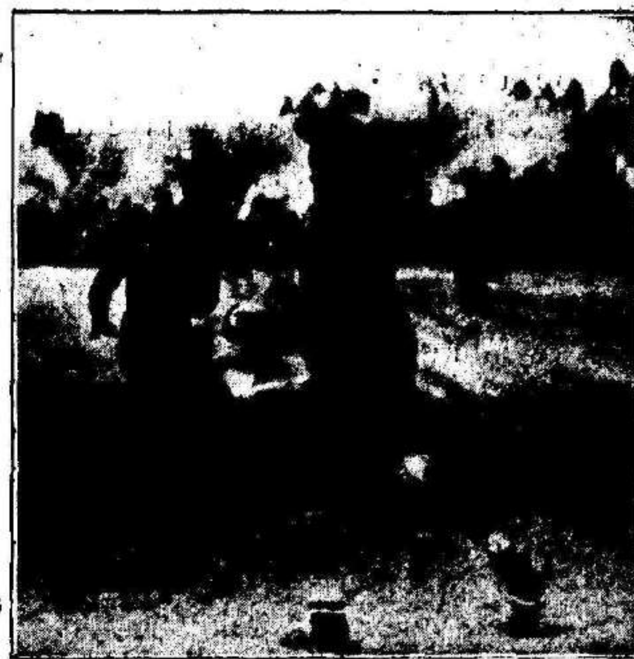
Júpiter-Murcia Una zamorana de Ibars