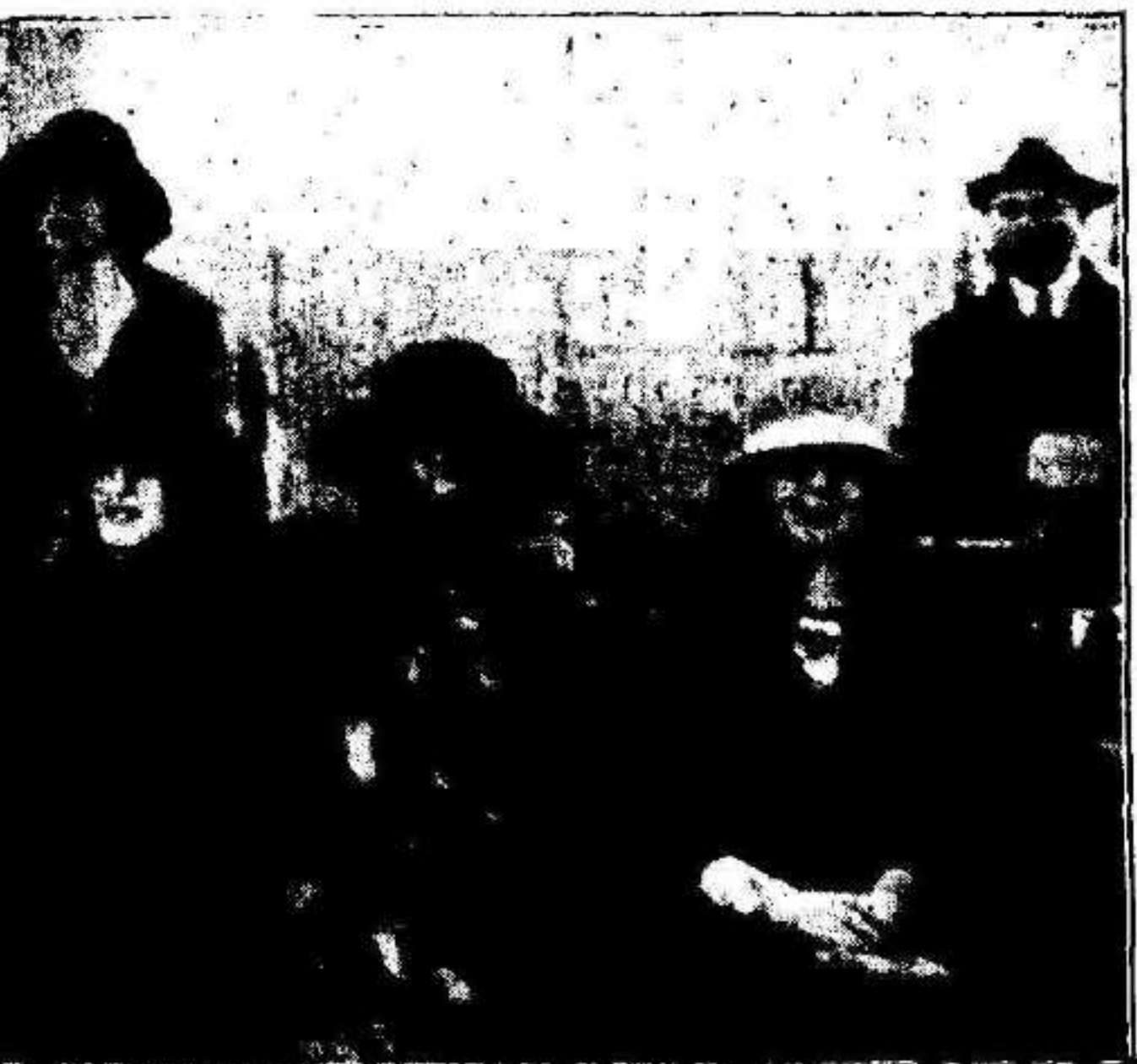
...por bellas oriolanas en la inauguración ...nuevo campo