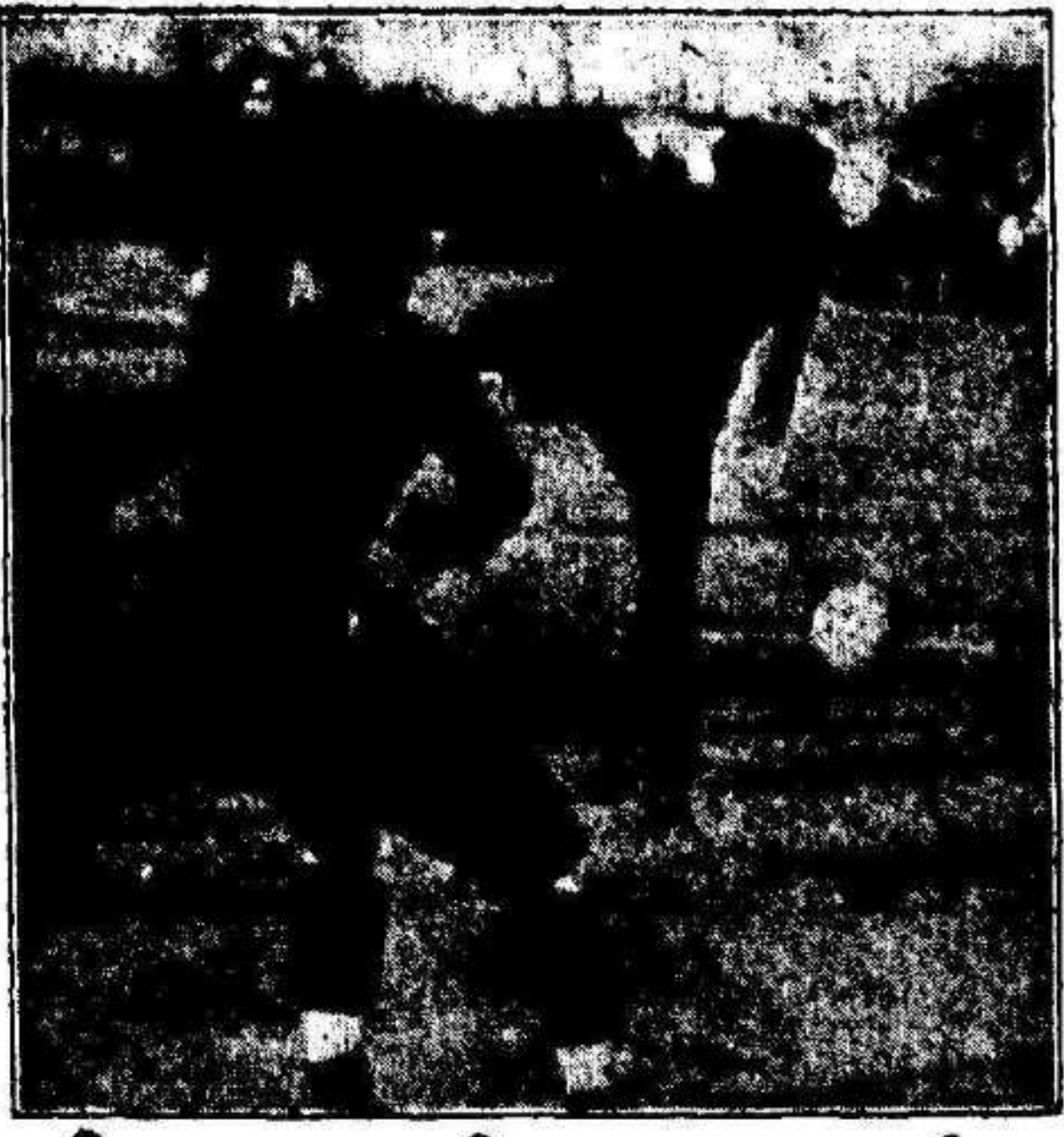
Júpiter-Murcia Un fuerte school de Guerdiam que Ibars defiende con dificultad