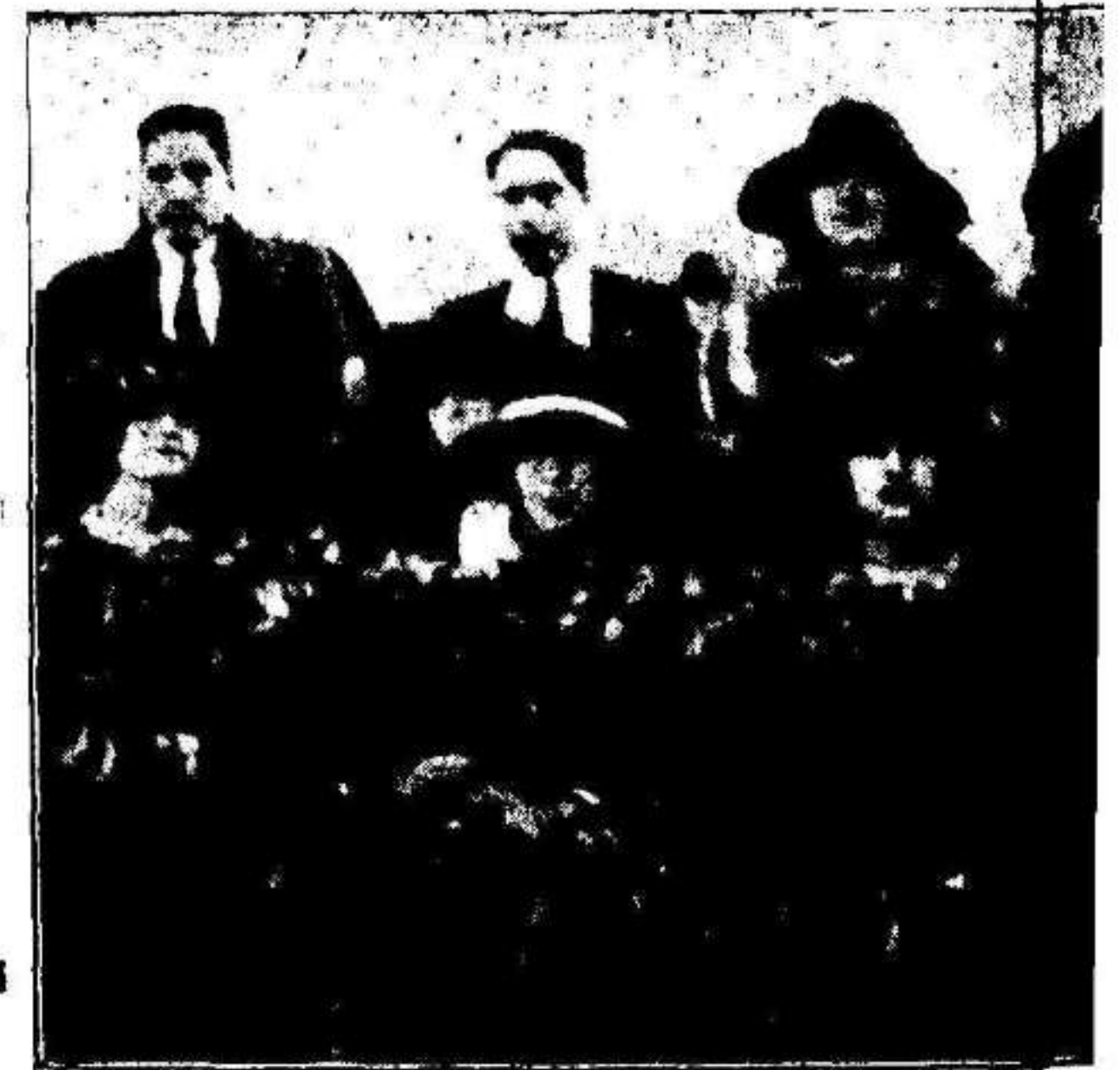
ORIHUELA. Una tribuna ocupada por el nuevo