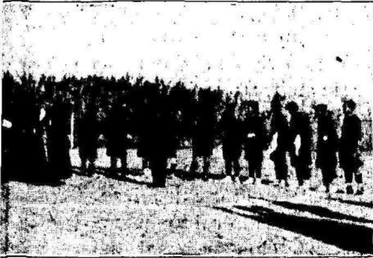
...uela, bendiciendo el nuevo campo de futbol.

En los días 25 y 27, en el campo de Alcantarilla F. C. contendieron en la citada Villa el Triángulo F. C. y el Nacional F. C., equipo de reciente fundación, el que unida la victoria conseguida en estas dos tardes por 5 a 1 y 3 a 0 a la del 31 sobre el Atué F. C. por 2 a 1, no dudamos que con perseverancia y amor al noble Sport esté muy lejana la fecha en que sea uno de los más temibles equipos de la Región ocupando uno de los primeros puestos en su categoría.— Ante