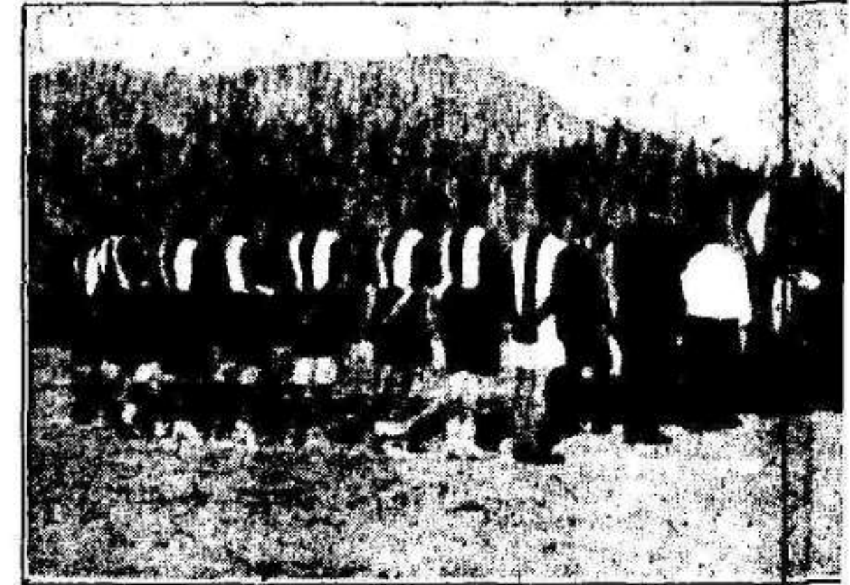
ORIHUELA.—Ilmo Sr. Obispo de Orihuela