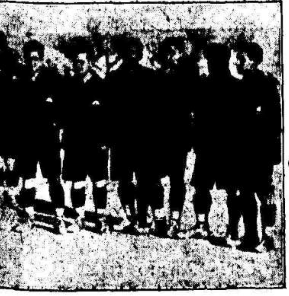
Barcelona vencedor del Real Murcia