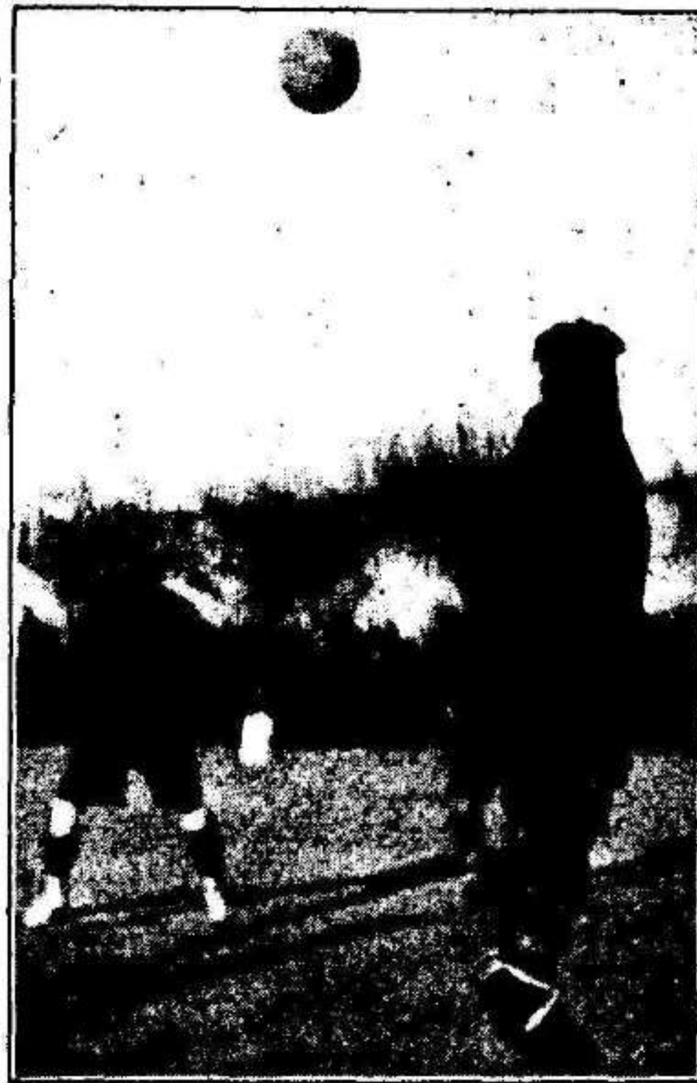
Unión Sporting-Murcia Un buen despeje de cabeza de Roselló