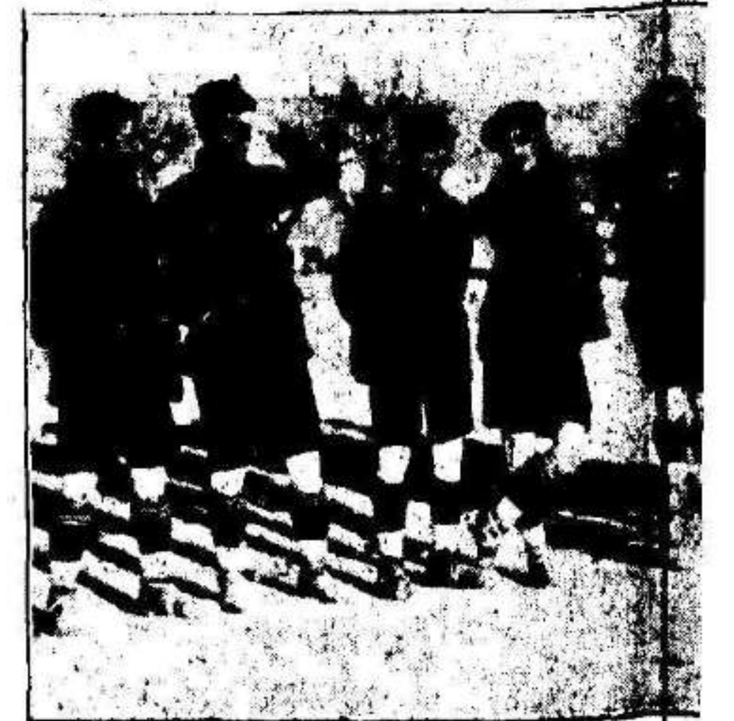
El notable equipo Júpiter de Bar