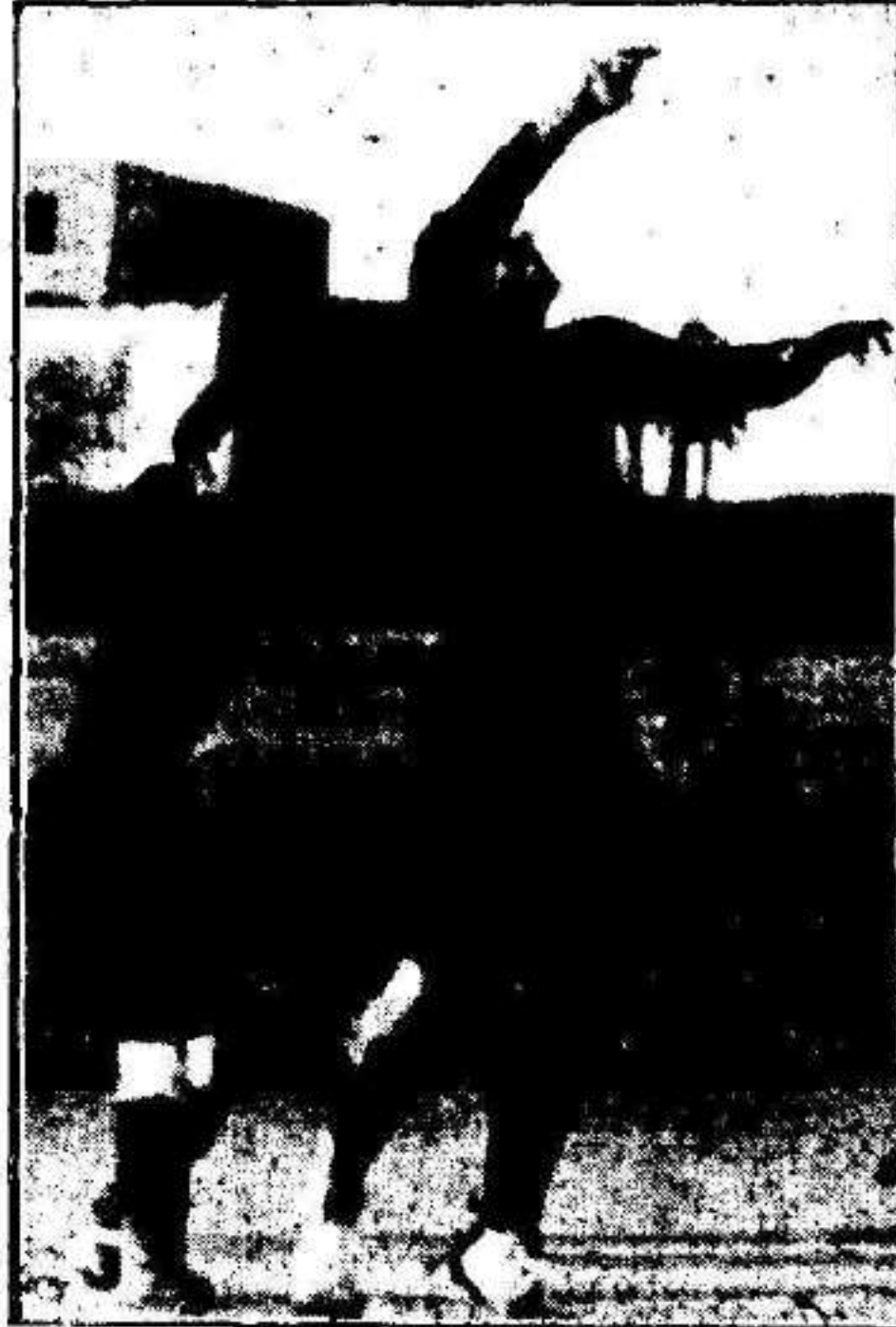
Unión Sporting-Murcia Tapia (M) despejando un corner