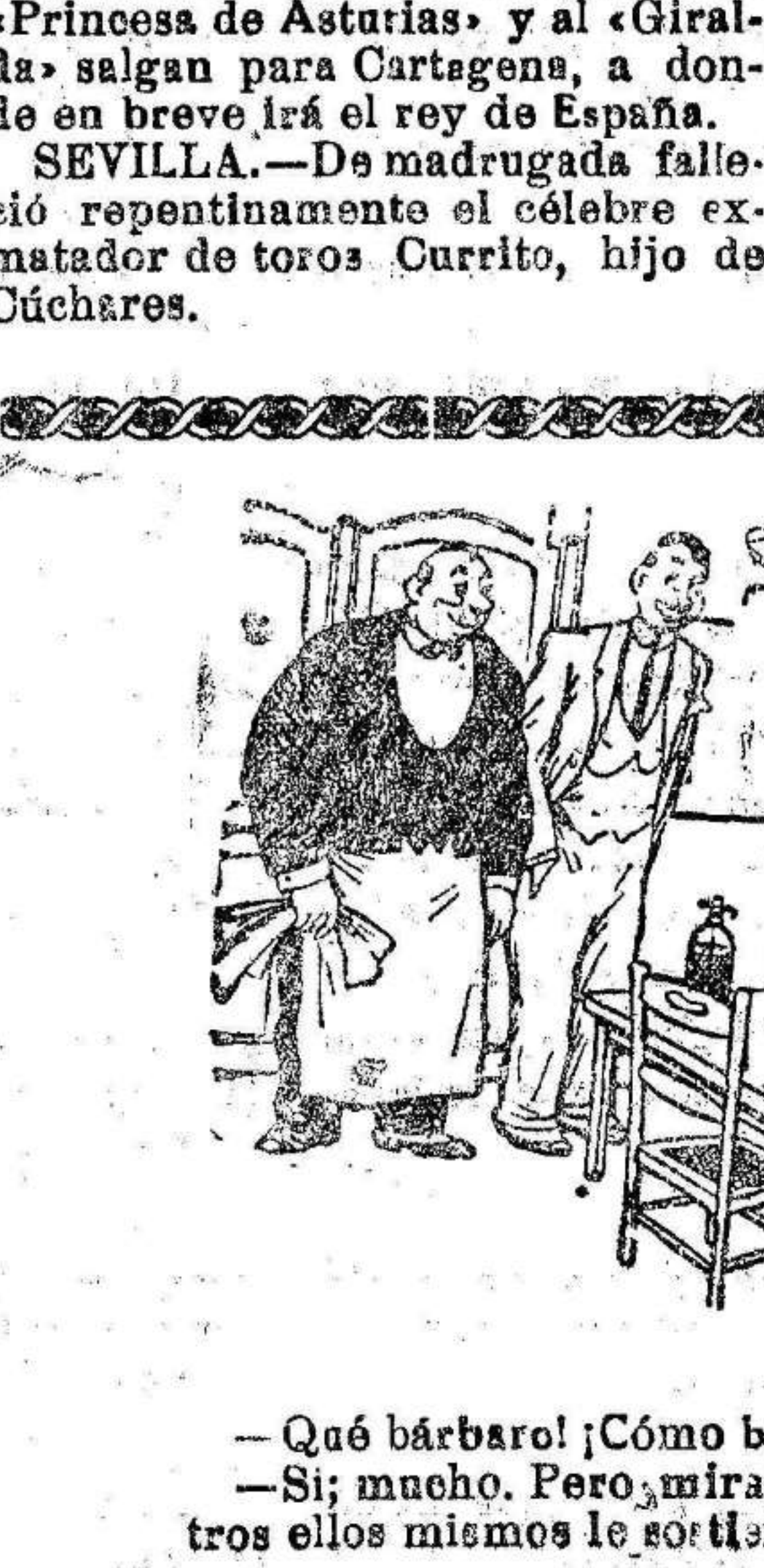
—Qué bárbaro! ¡Cómo bebe ese tío! —Sí; mucho. Pero, mira; cuando tiene muchos felices ellos mismos le sostienen.