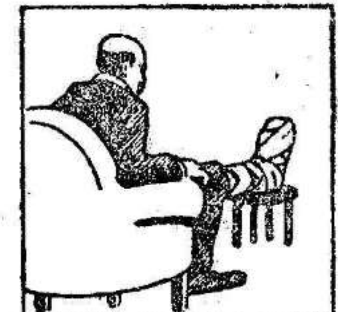
Gota - Dolores