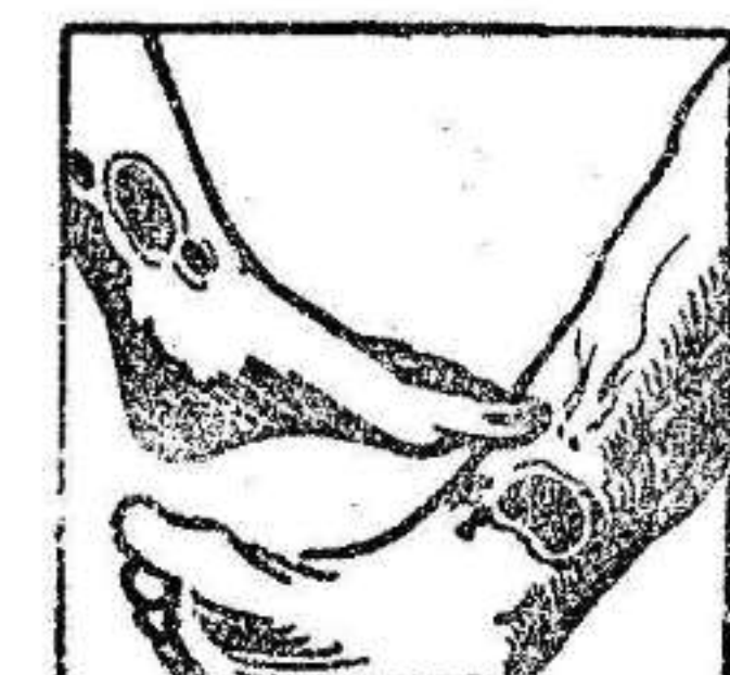
Males en las piernas

La sangre del artrítico esta entorpecida por venenos que provienen de una insuficiencia de vitalidad y por consiguiente, su circulación es del todo defectuosa. Las piernas del enfermo estan hinchadas y entorpecidas con varices dolorosas con peligro de ruptura o de ulceracion interminable. Con frecuencia el artrítico esta atormentado con dolores potosos o reumáticos que le hacen achacosos y con el tiempo se agotan. Sus riñones estan generalmente obstruidos con nefritis, albuminuria; arena en la orina (mal de piedra) y a veces fuertes dolores en la espalda. Las arterias duras y quebradizas como tubos de pipa (arteriosclerosis) amenazan a cada instante, accidentalmente generalmente pronosticando con insomnios y dolores de cabeza. La mujer artrítica tiene epocas irregulares o penosas y su edad critica es un largo suplicio, con bocanadas de calor, vertigos, jaquecas, postracion profunda, con frecuencia fibromas o tumores en el vientro. Los artríticos de ambos sexos tienen tambien enfermedades de la piel, acné, eczemas, herpes, sarpullidos, prurigo, soriasis, forunculosis, etc., con lesiones molestas y comezones intolerables. Todos esos enfermos de la sangre, todas esas victimas martires del artritis no tienen que desesperarse y creerse incurables pues el