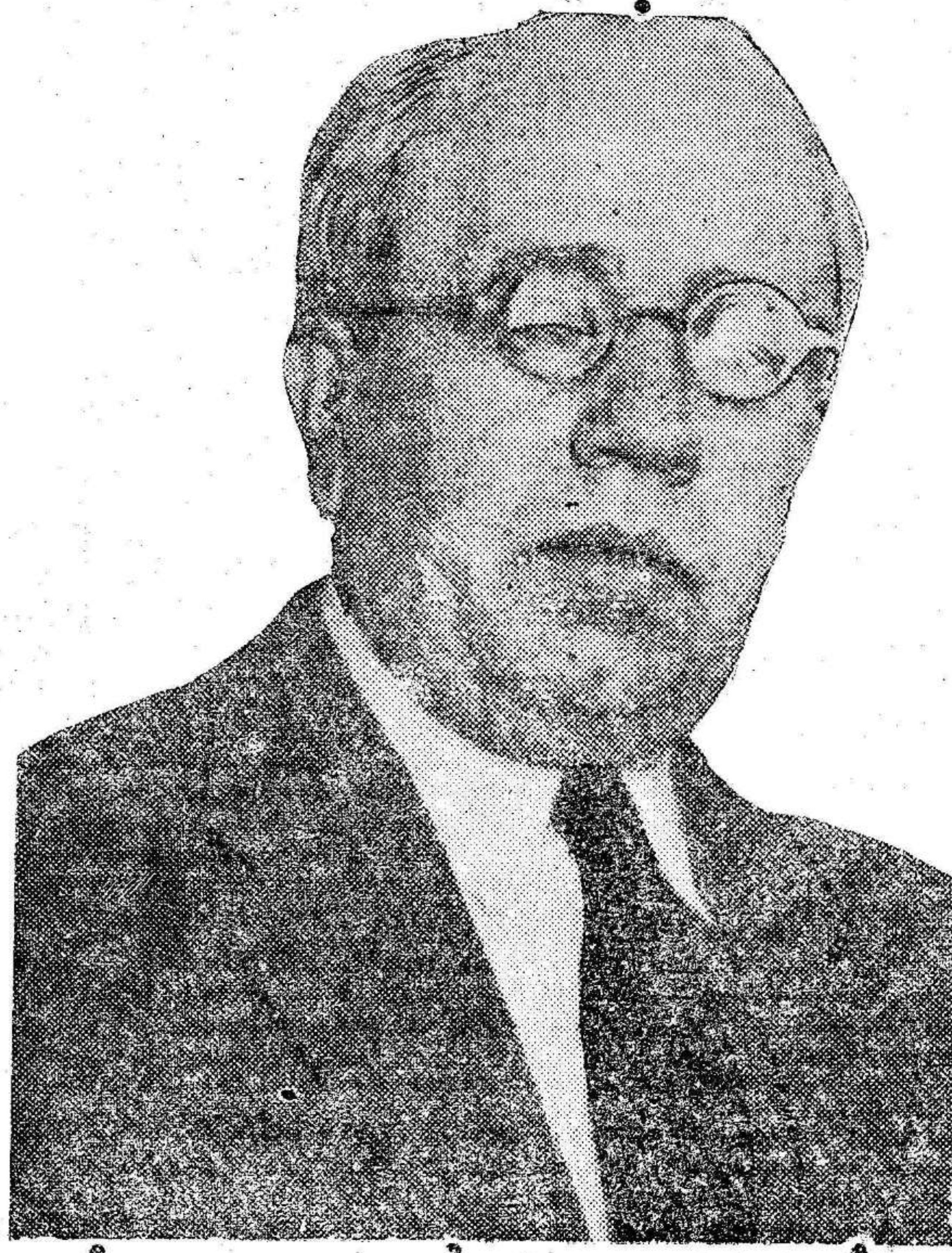
DON MANUEL AZAÑA

No se confunda esta aspiración con el deseo de violencias ni radicalismo inadecuados. Quiero decir que se debe ya notar que hace seis meses cayó la monarquía para sí misma. Porque el pueblo, desgraciadamente, no lo ha notado todavía.