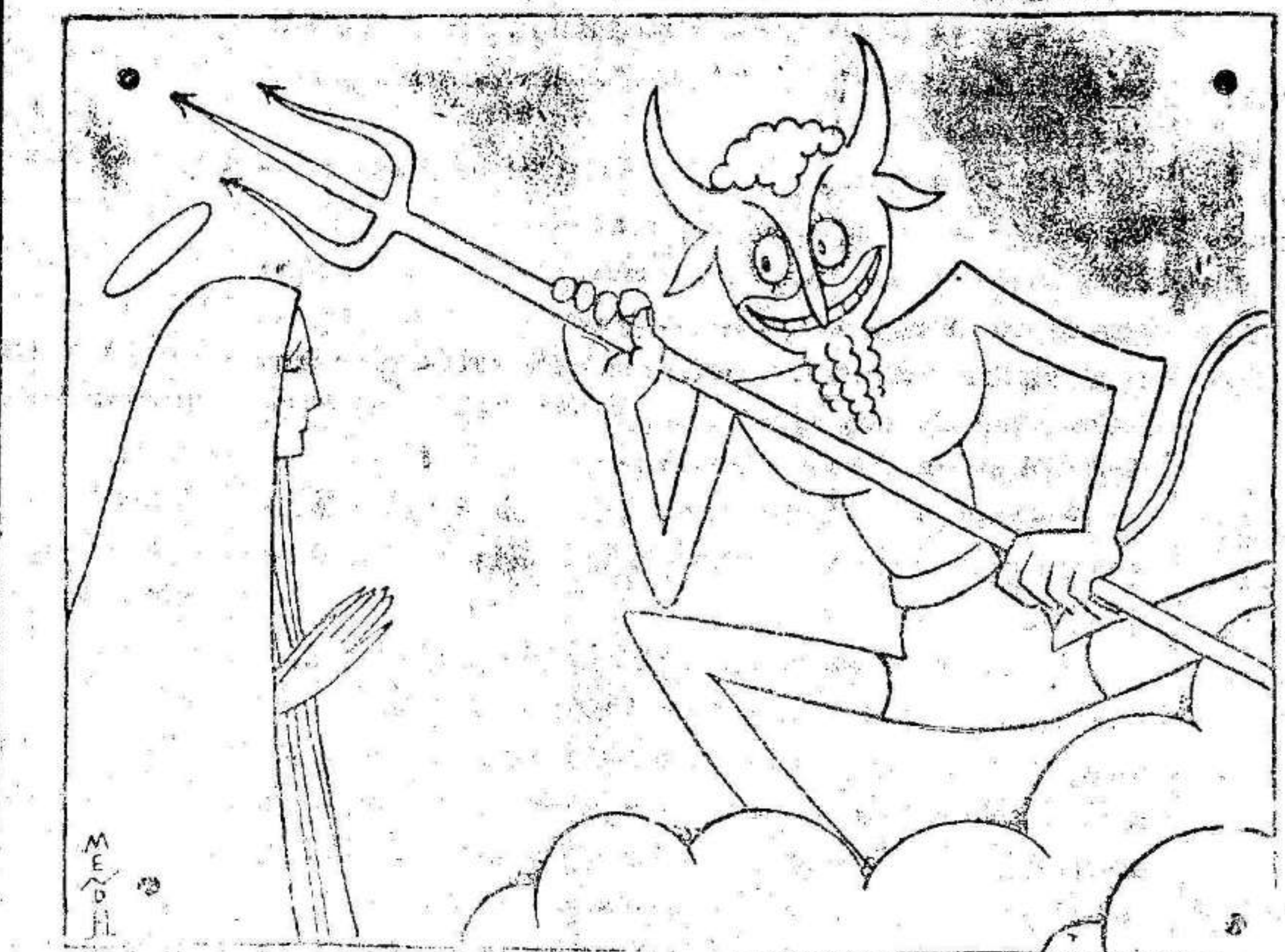
LAS APARICIONES EN EL MONTE. —Bueno, ¿y ahora dónde hay que pasar la facturita?

Los partidos republicanos. Nuevo Círculo Radical. Los elementos radicales del Barrio del Carmen afectos a la política del señor Lerrooux han instalado un nuevo Círculo situado en la Alameda de Colón. Se trata de un local bastante amplio, con todas las comodidades posibles en esta clase de sociedades y sus organizadores se muestran muy satisfechos, pues apenas abierto cuenta ya con más de cuatrocientos socios. La inauguración oficial del nuevo círculo se verificará en la primera decena del próximo mes de agosto.