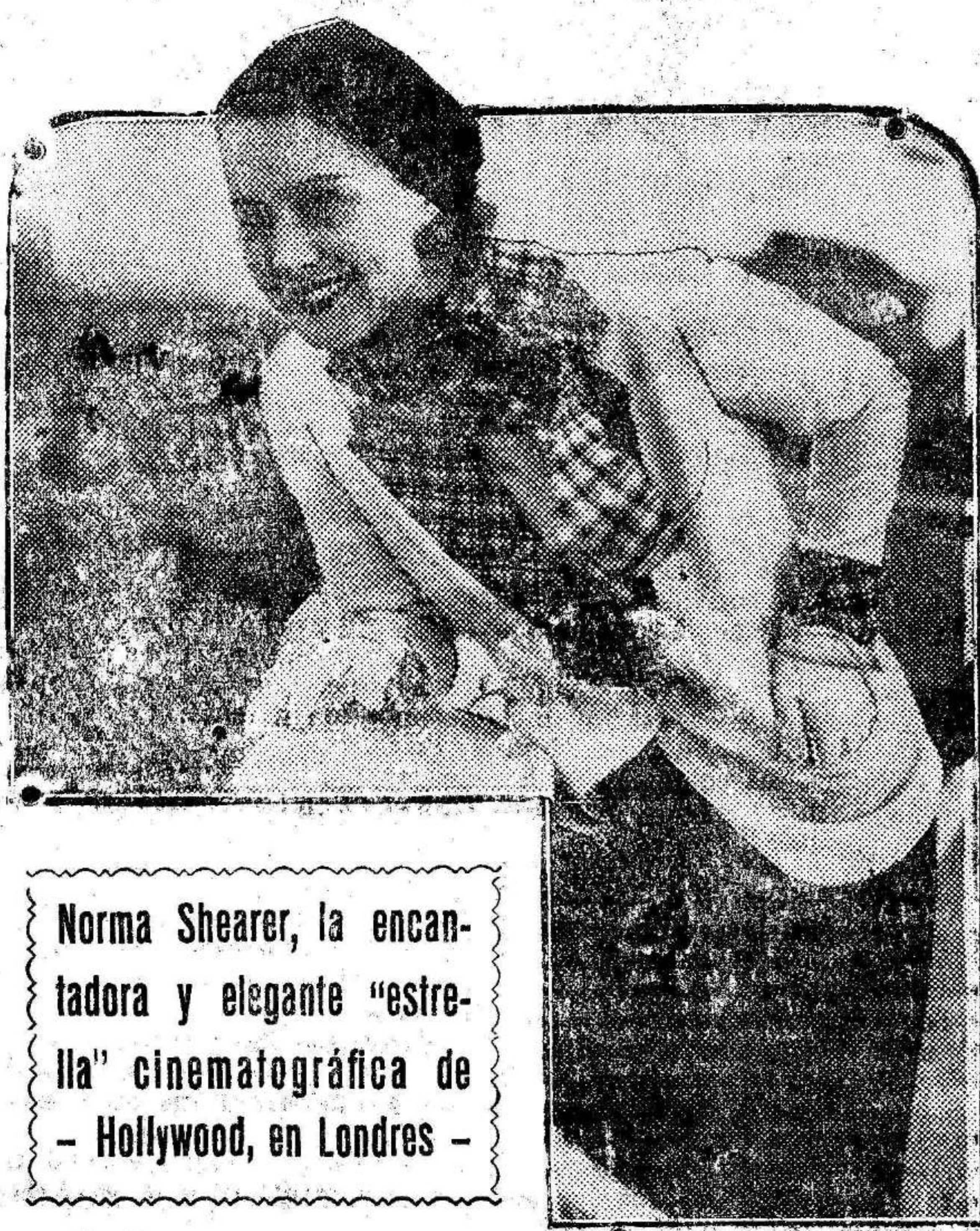
Norma Shearer, la encantadora y elegante "estrella" cinematográfica de Hollywood, en Londres.

Con este objeto se ha preparado próximamente a un tercio de la longitud del dirigible a partir de la proa—una cámara de 22 metros de largo por 8 de ancho. Dos puertas a corredera, instaladas en el fondo de este departamento, cubren una abertura en forma de T; a través de ella se puede hacer subir o bajar un trapecio, al cual va suspendido