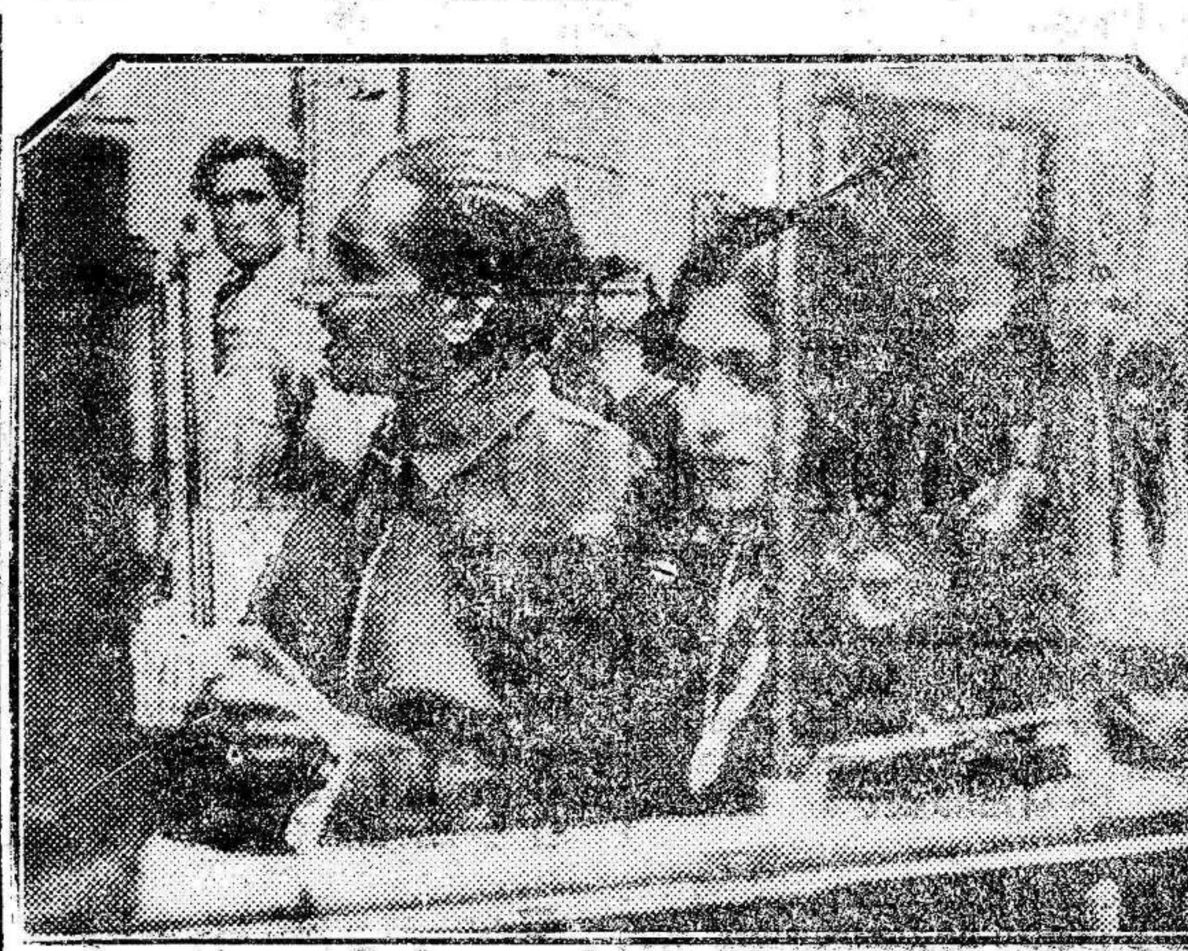
El maharaja de Indore, con su bellísima esposa, paseando por las calles de Barcelona, donde se hallan actualmente.