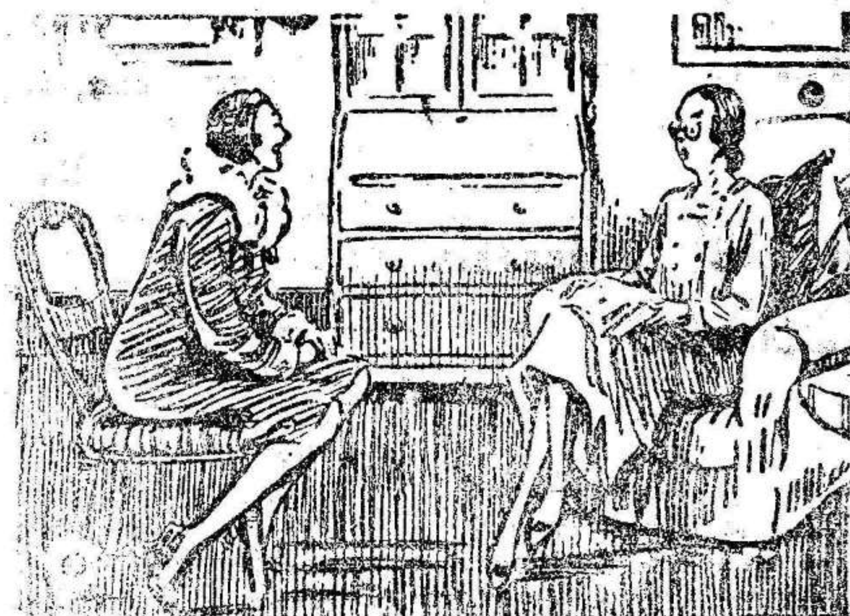
LA SEÑORA (a la criada que va a pretender). ¿Y qué le dijo su última señora cuando usted se marchó? LA PRETENDIENTE.—Nada. La encerré en el cuarto de baño, cogi mi bañi y mi fui.

Habrà agua abundante para hacer tres riegos al año, en la forma y época que se desee. En Pozo Estrecho, y para el mejor aprovechamiento de estos regadíos, se instalará una Granja Agrícola modelo, una Escuela agropecuaria con todos los adelantos en las que se mostrará al labrador cuáles han de ser los cultivos de nuestro campo para que la tierra rinda más y cuáles los ganados que se han de criar para que produzcan más beneficios.