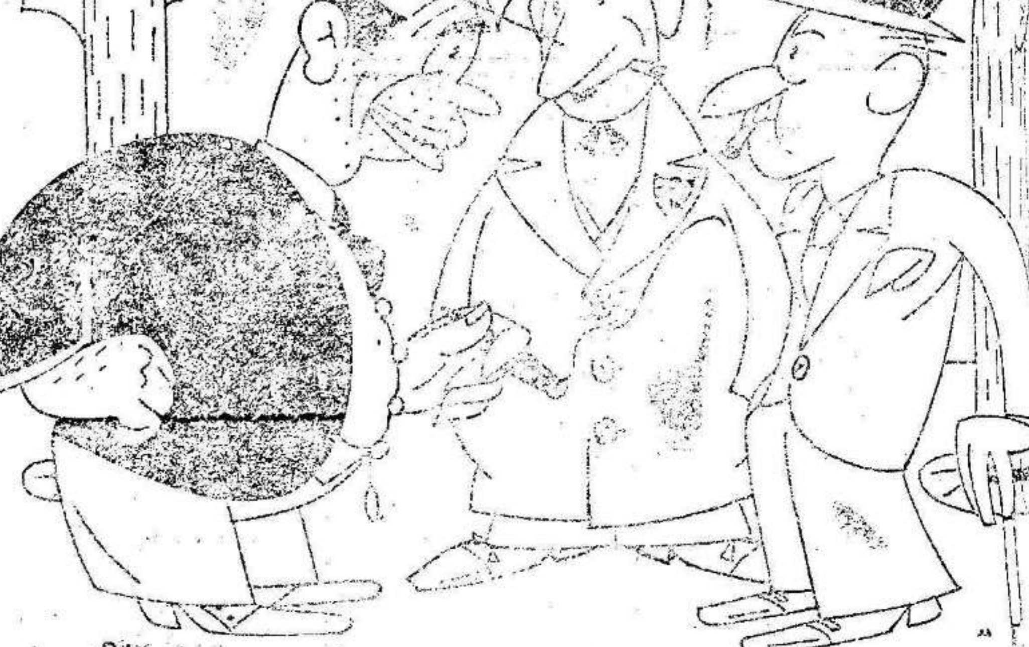
¿Y por qué ese picador, al retirarse se ha metido a reír del tren? «Por la costumbre! Como se ha pasado tantos años picando toros, ahora se ha metido a picar billetes.»

Este periódico ha sido visado por la censura gubernativa.