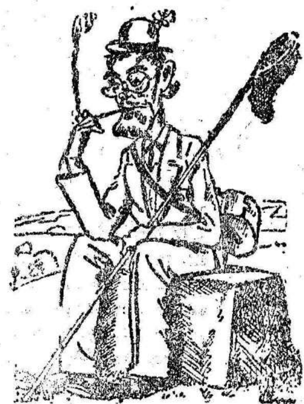
EL PENSADOR.—Es extraño! Los que trabajan en el campo son todos campesinos; ¿por qué los que trabajamos en la capital no somos capitalistas?