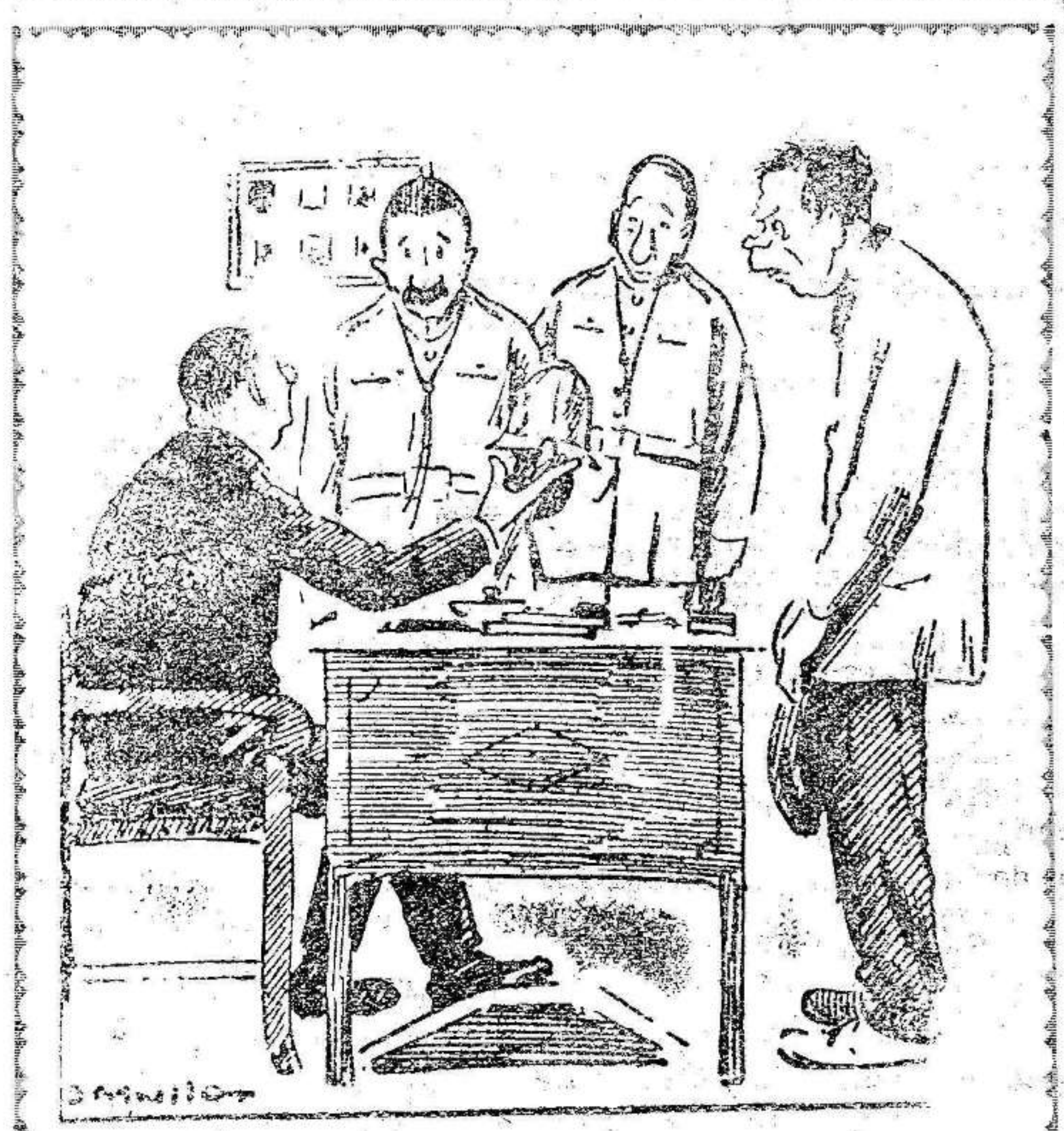
—Traemos a éste porque ha «mondado» a su suegra de una paliza. —¿Y sólo por eso le hacéis venir aquí? —(La Unión Mercantil.)

Saltos de altura. Saltos de longitud. 110 metros vallas. Carreras de relevo. Lo que ponemos en conocimiento de los Clubs afiliados para que estos lo hagan saber a sus respectivos atletas.—El Comité.