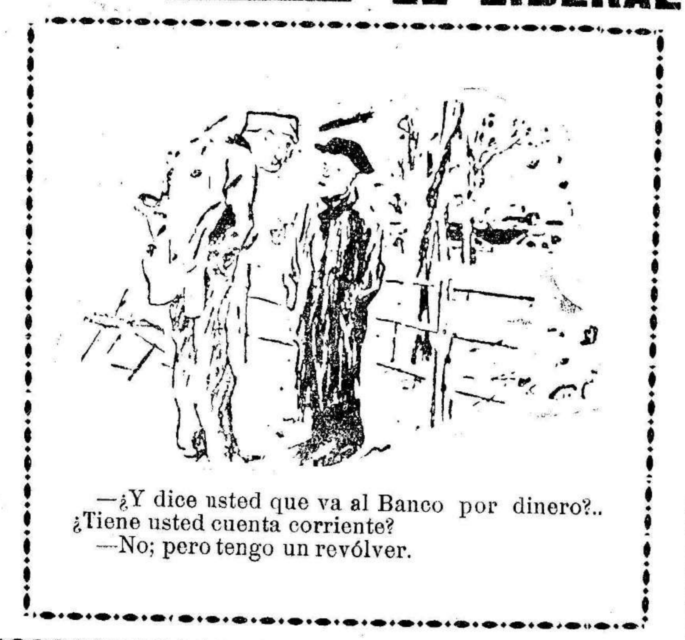
—¿Y dice usted que va al Banco por dinero? ¿Tiene usted cuenta corriente? —No; pero tengo un revólver.

Después de este partido creamos que ha terminado la intervención del equipo aguilero en el campeonato de este año.—C.