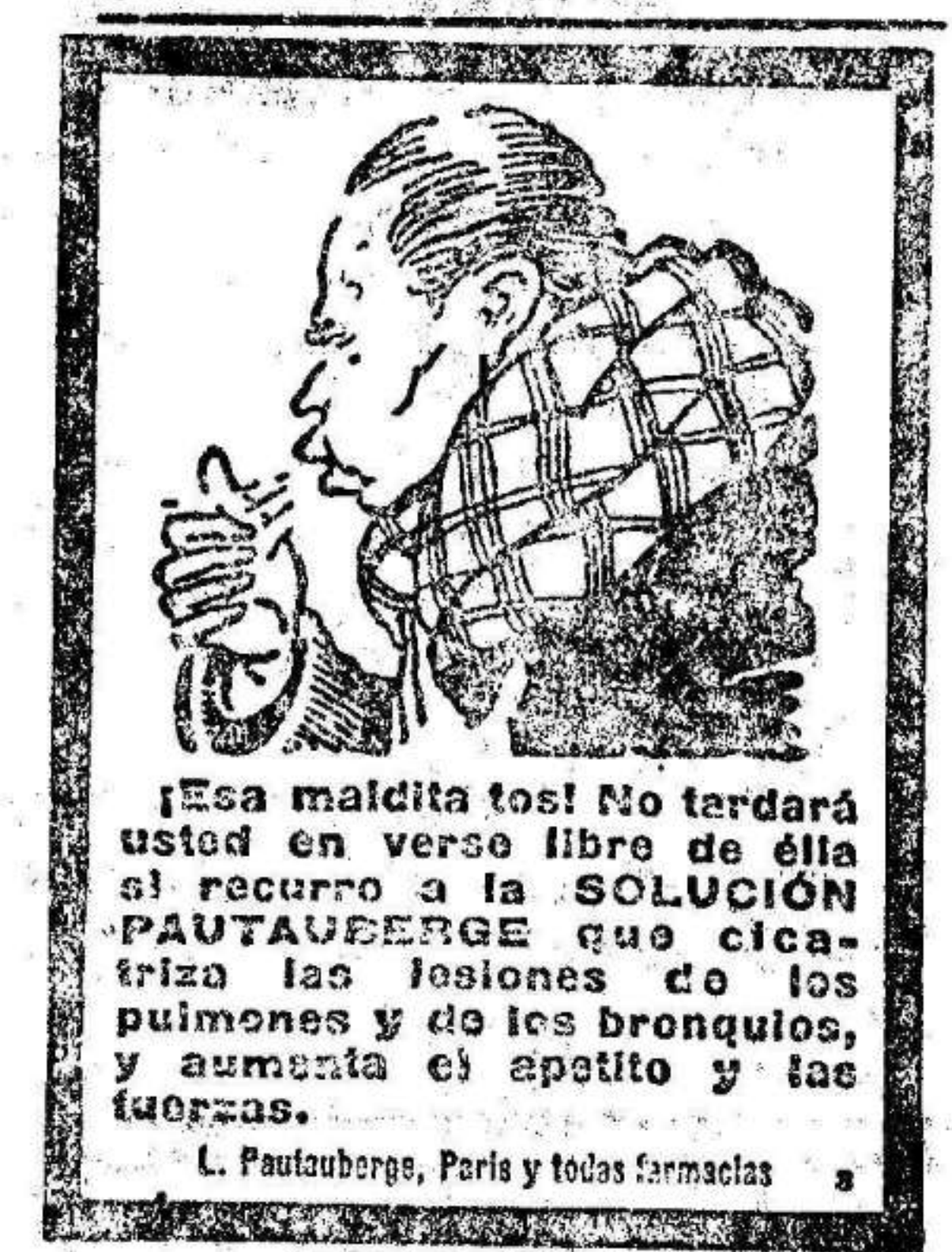
¡Esa maldita tos! No tardará usted en verse libre de ella si recurre a la SOLUCIÓN PATENTADA...

Persona de edad que hable francés para sereno de hotel.