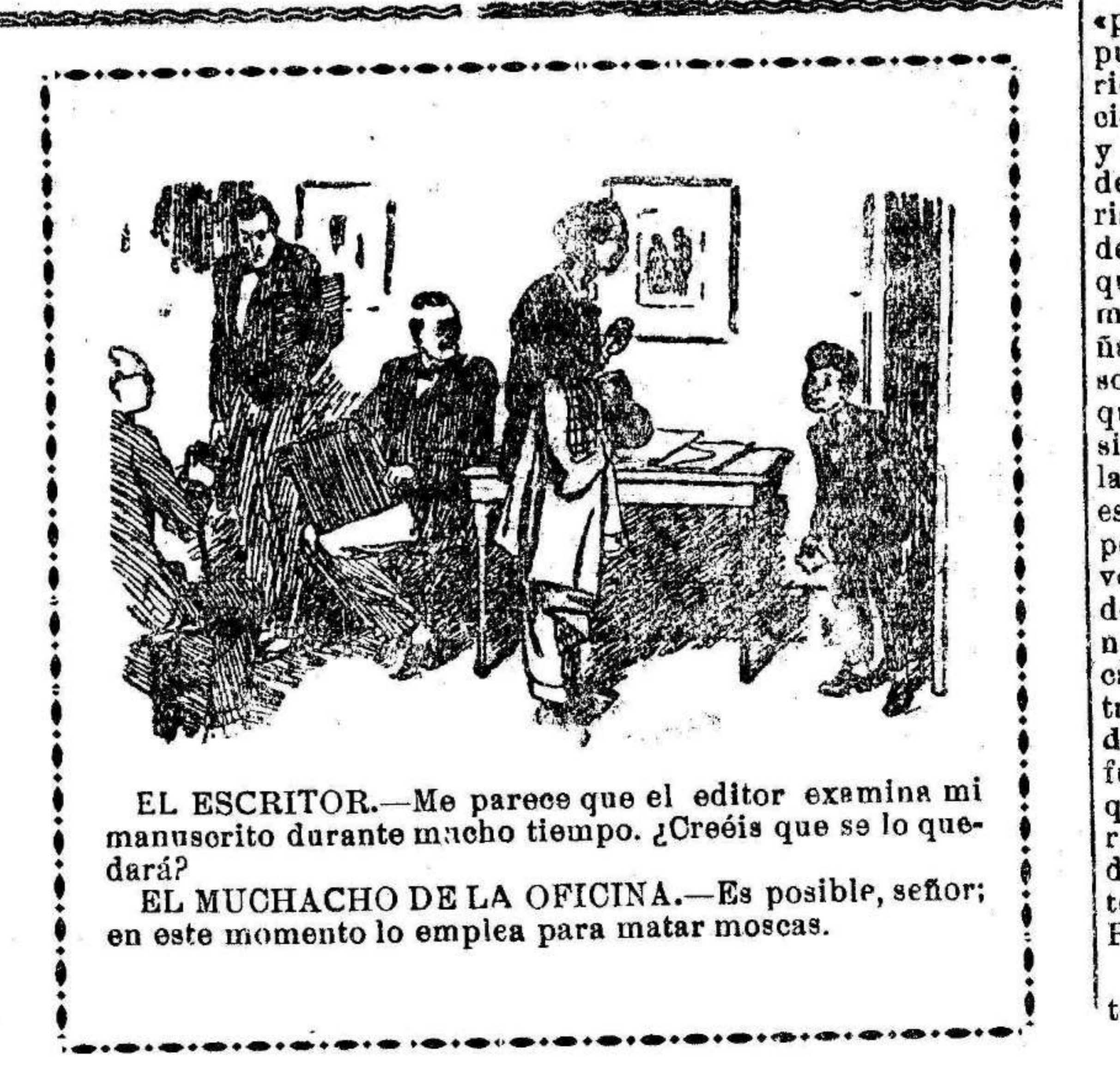
EL ESCRITOR.—Me parece que el editor examina mi manuscrito durante mucho tiempo. ¿Creéis que se lo quedará? EL MUCHACHO DE LA OFICINA.—Es posible, señor; en este momento lo emplea para matar moscas.