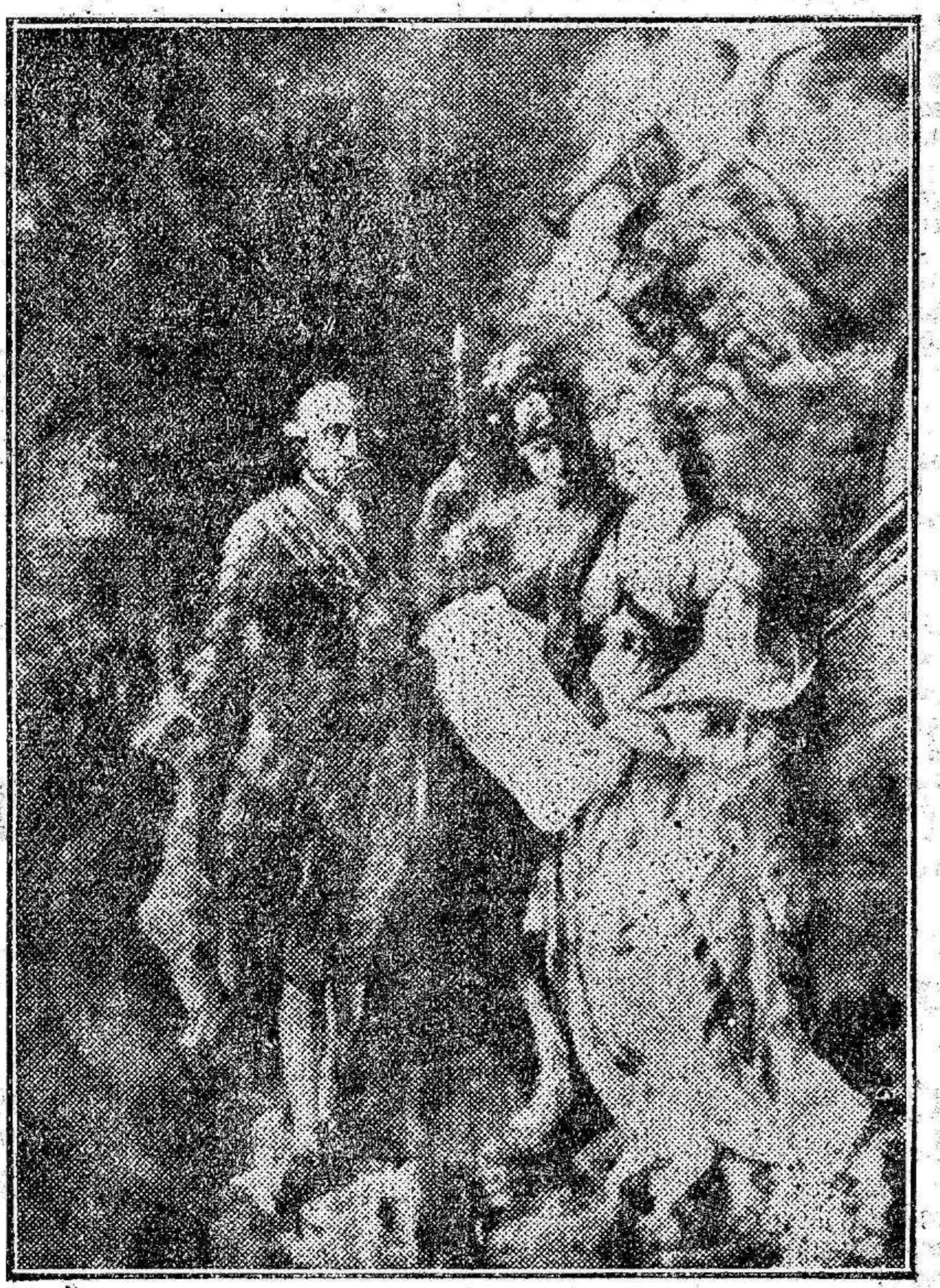
Reproducimos el cuadro existente en el Ayuntamiento de esta capital, que restaura en la actualidad el notable pintor don Angel Ayala. Fué encargado por la Corporación municipal en 1787 al pintor don Francisco Folch de Cardona para expresar al Conde de Floridablanca su agradecimiento por las obras de encauzamiento del río Segura. La Ciudad, representada por la matrona, exhibe a su hijo predilecto los planos que el concibiera y trazara por su encargo el arquitecto don Manuel Serrano. Su ejecución se vio truncada por la inesperada caída del primer ministro, que no pudo hacer por Murcia cuanto él deseaba.