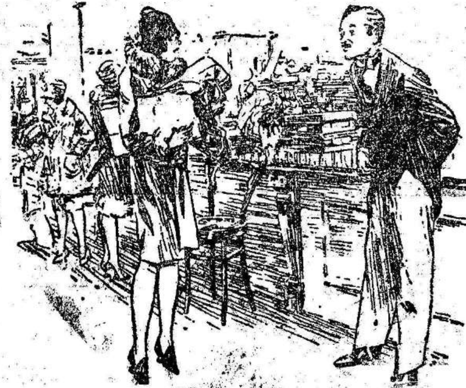
La señora.—He citado a mi marido enfrente de este mostrador hace una hora. ¿No lo ha visto? El dependiente.—¿Es uno con cara roja? La señora.—¡Oh, sí! ¡Debe ya de estar casi blanco de robía!