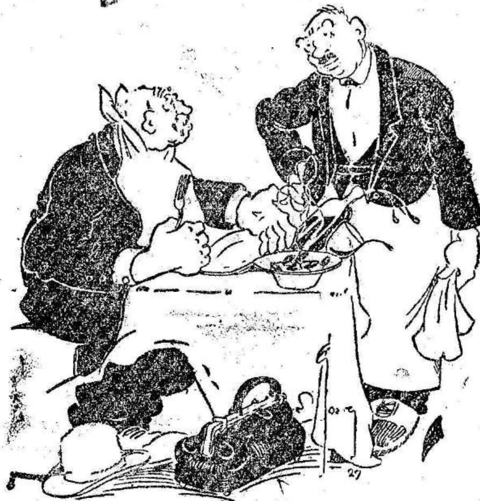
—Diga usted, mozo: ¿y a esto lo llaman ustedes calamares frescos? Pero si están ardiendo!

Dos hoteles quedaron completamente inundados, teniendo que ser desalojados por los huéspedes.