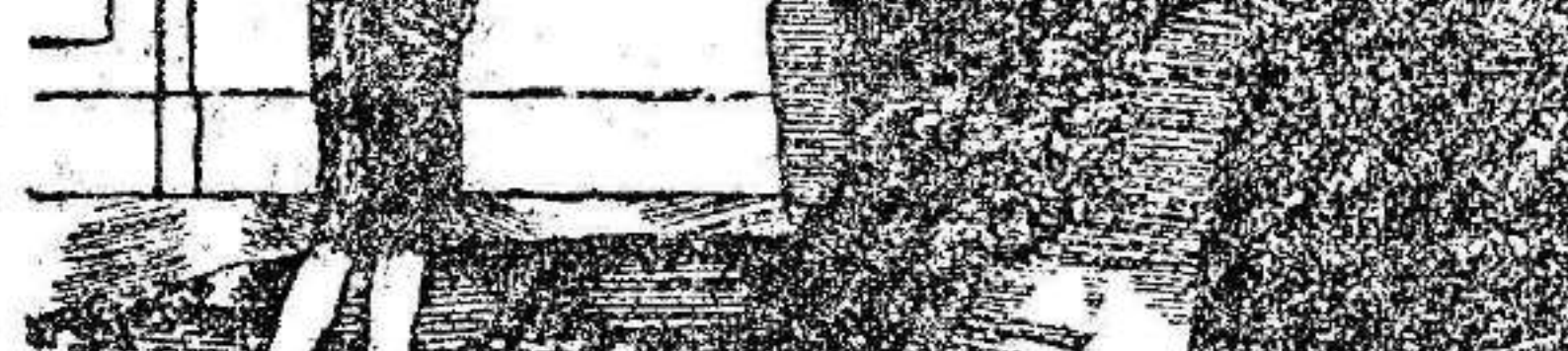
—Pero ¿cómo quieres que te compre un auto, con lo cara que está la gasolina? —¿Y por qué te has comprado tú encendedor?