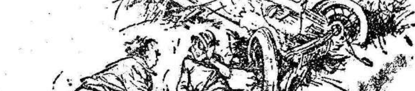
—Menos mal... ¡Por lo menos, querido, no tendrás que meterte bajo el coche para repararlo!