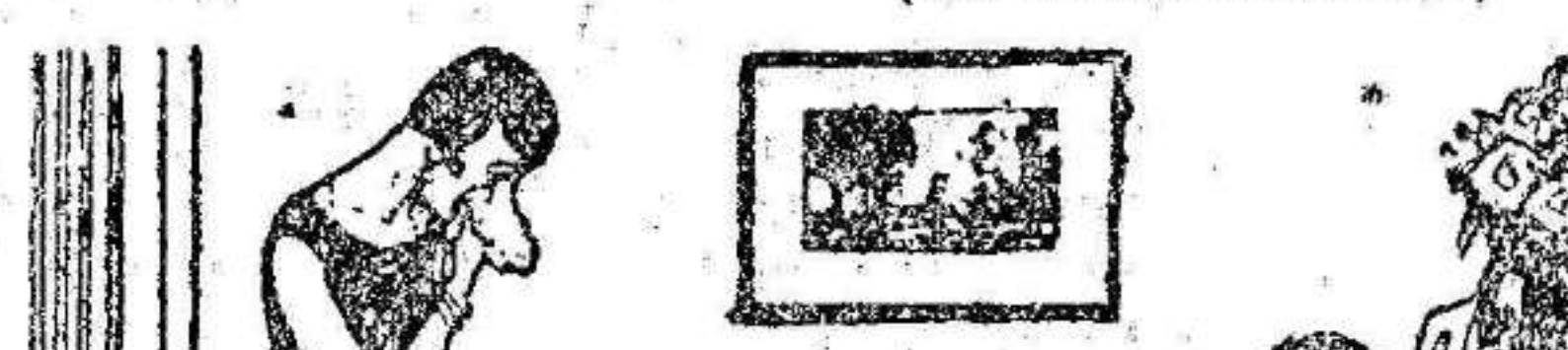
(Le Petit Journal)