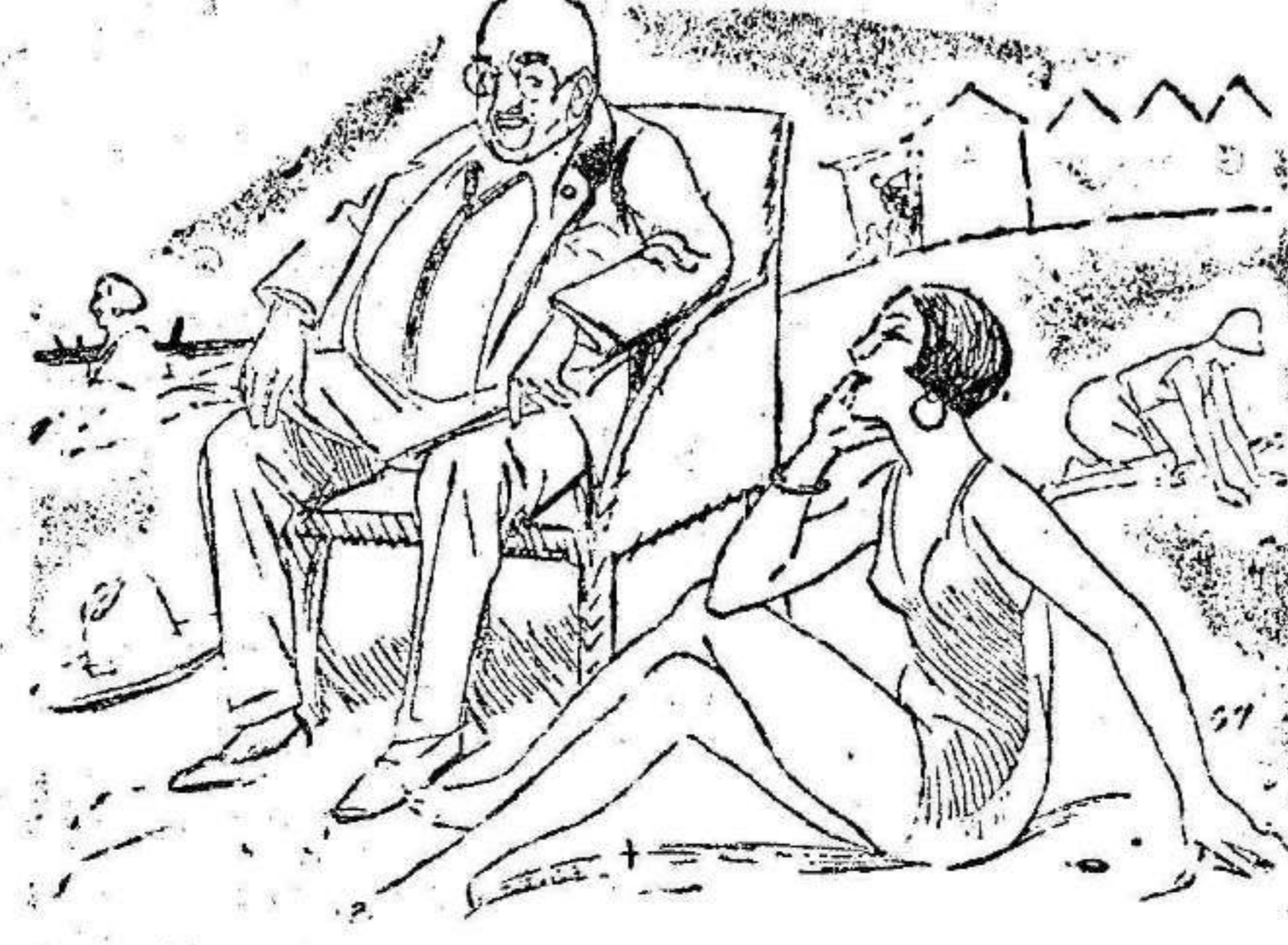
—¿Qué te parece?—El fondista me ha dicho que no podía recibir en el mismo cuarto a un tío y a una sobrina. —Eres tonto, querido; haberle dicho que eras mi abuelo.