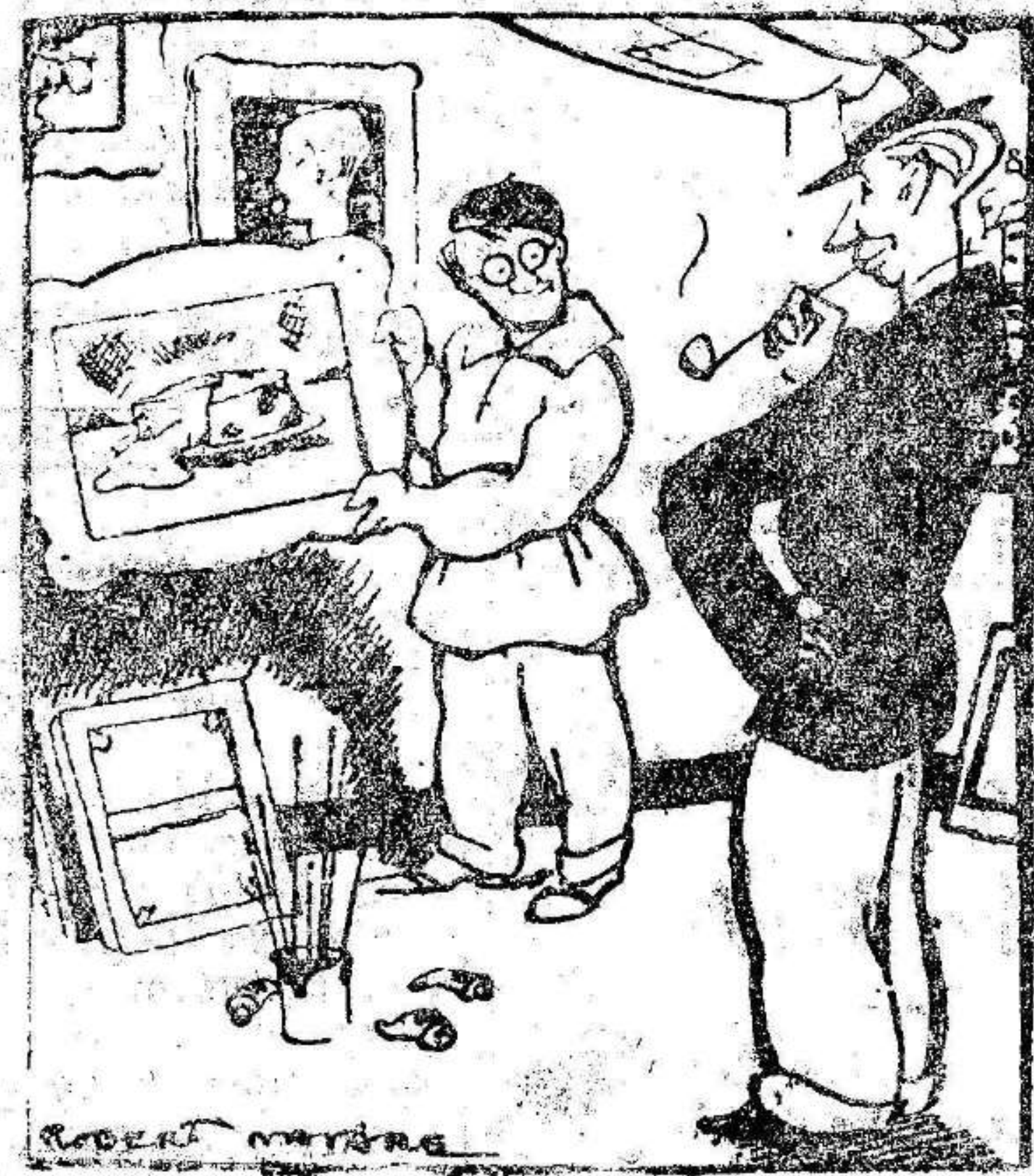
—Mire usted el cuadro que me han recha- zado en la Exposición... —¡Qué injusticia!... Seguramente lo han encontrado demasiado avanzado... (Le Petit Journal.)