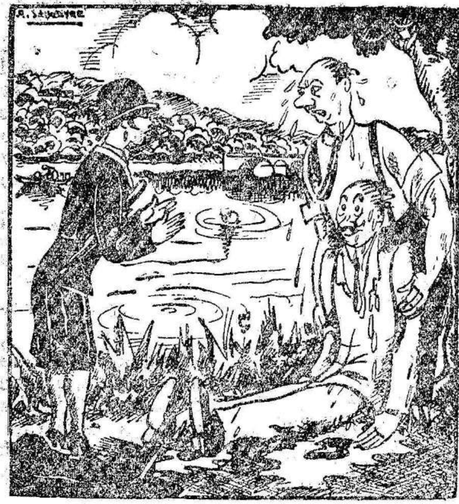
—¡Ha sido usted poco complaciente!... ¡Ya podía usted haber cogido el sombrero!... (Le Petit Journal.)