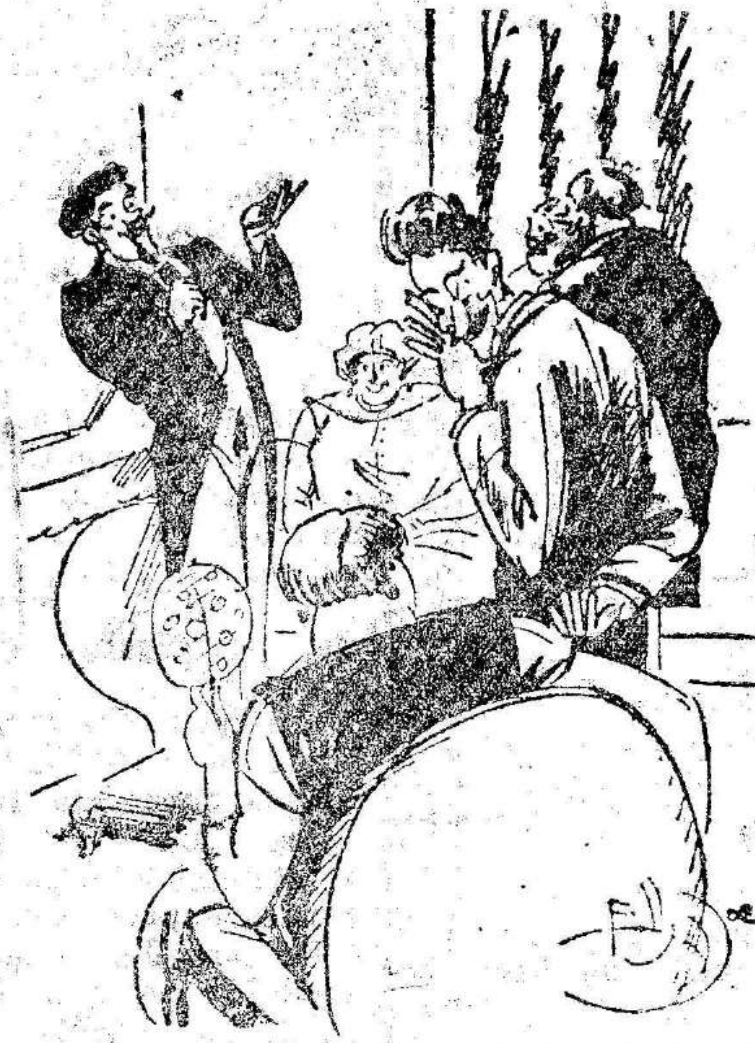
—¡Es realmente extraordinario! ¡Puede estar hablando seis horas seguidas! —Más extraordinario es el caso de su mujer, que puede estar seis horas callada. (Dimanche Illustré.)