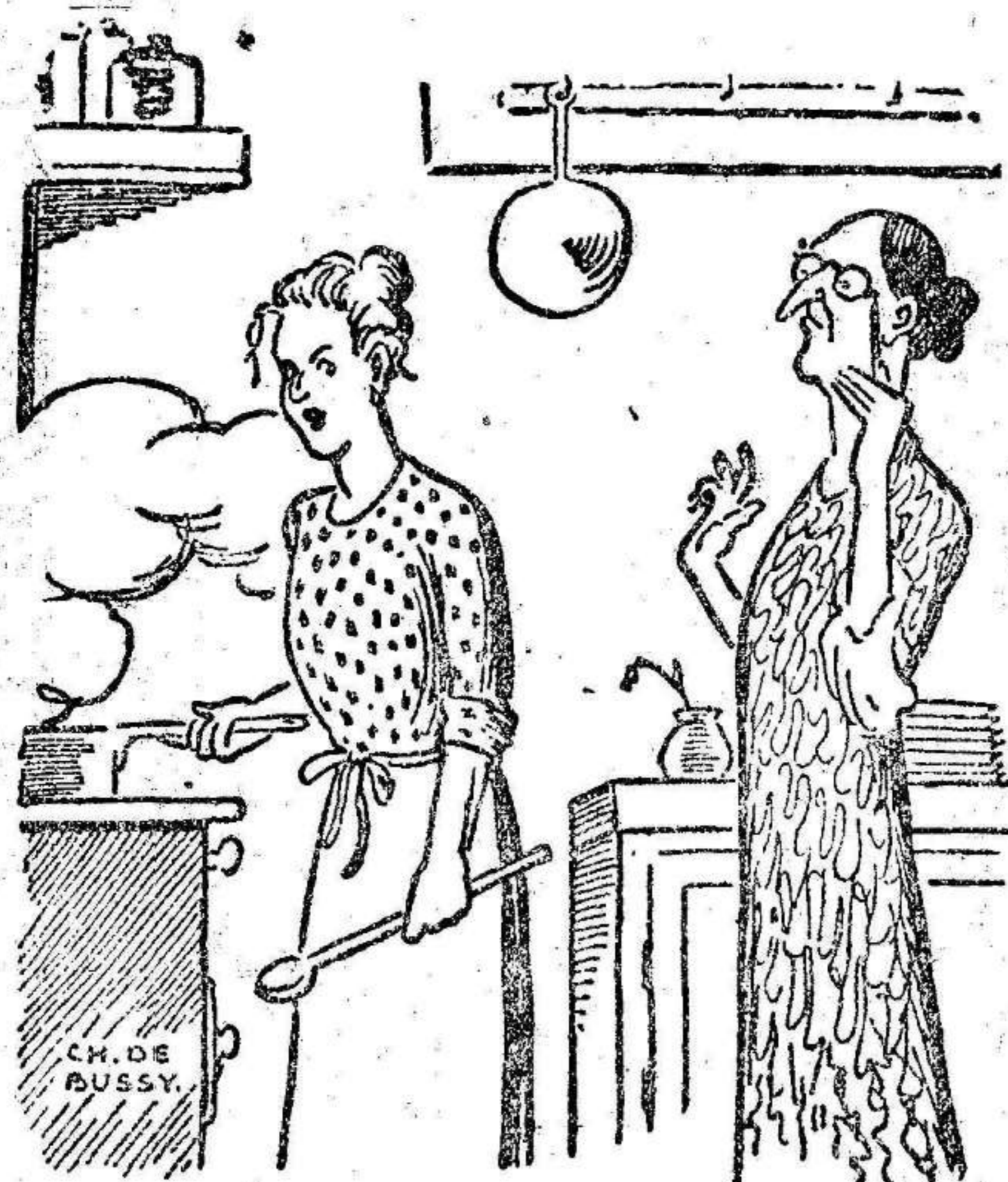
—Pero, desgraciada, ¿ha puesto usted las pesadillas sin limpiarlas? —No creía que fuese necesario, señora... ¡Unos animales que viven siempre en el agua!