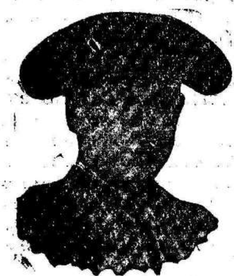
NIÑO DE LA PALMA