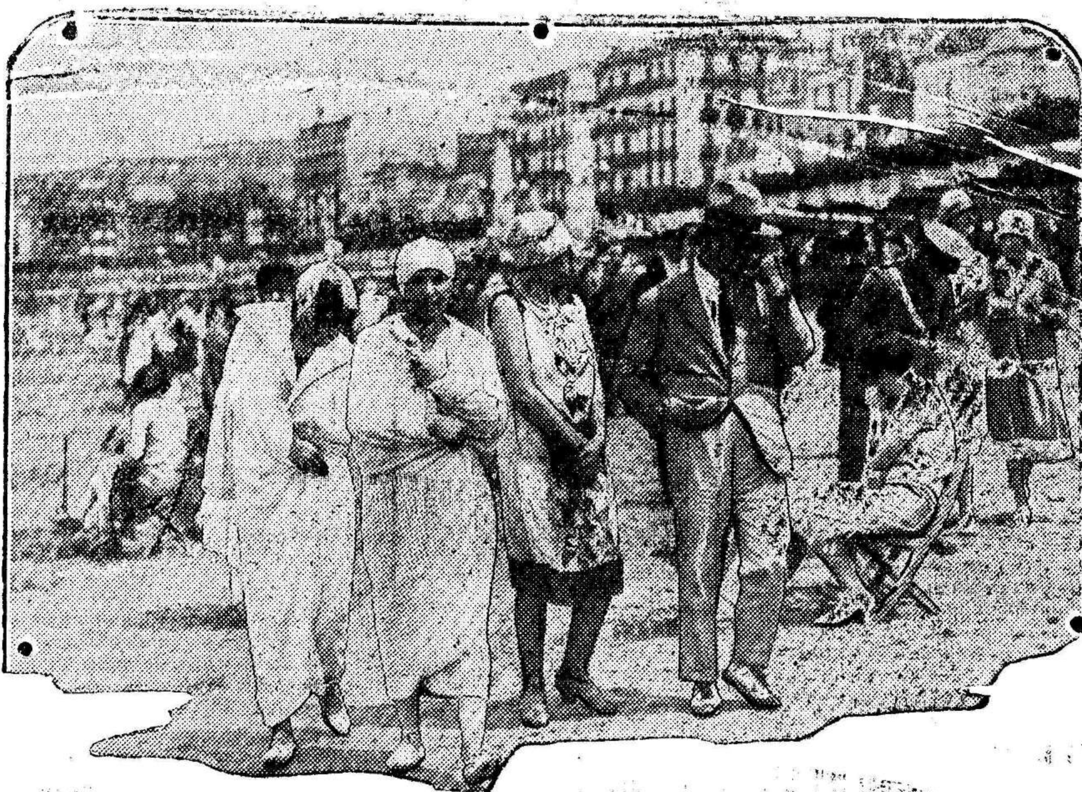
EN LA PLAYA DE SAN SEBASTIÁN.—Bañistas y paseantes disfrutando de la brisa marina

Dejemos, pues, la prosecución de estos comentarios para cuando se comience en toda su intensidad el debate aprobado.