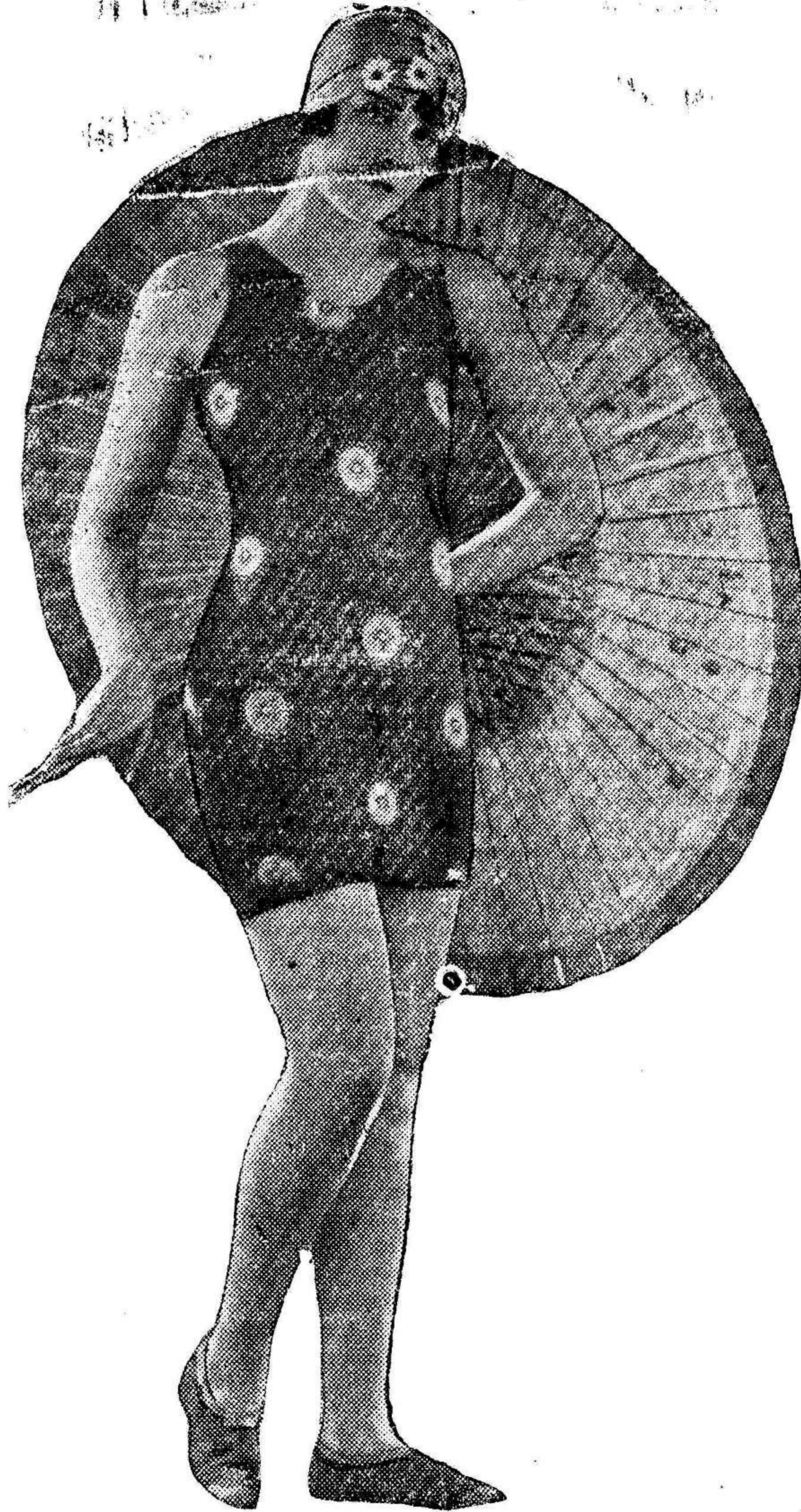
Un sugestivo modelo de bañador femenino visto en una playa extranjera.

(Conferencia telefónica) 12, a las 3 t. Madrid.—El Tribunal Supremo ha informado denegando el recurso interpuesto por el expresidente del Consejo, contra la multa de quinientas mil pesetas que le fué impuesta por la Presidencia del Consejo.