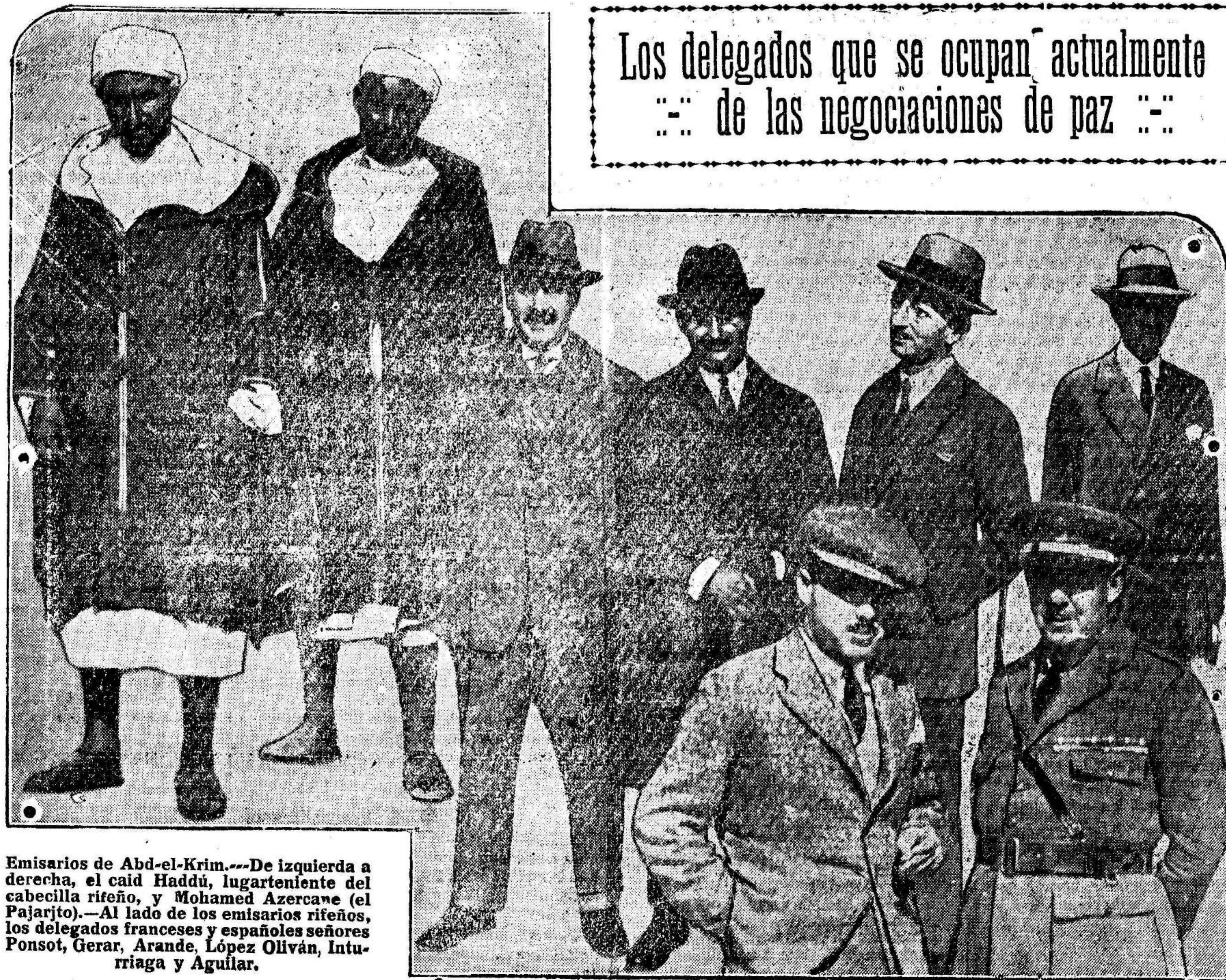
Los delegados que se ocupan actualmente de las negociaciones de paz