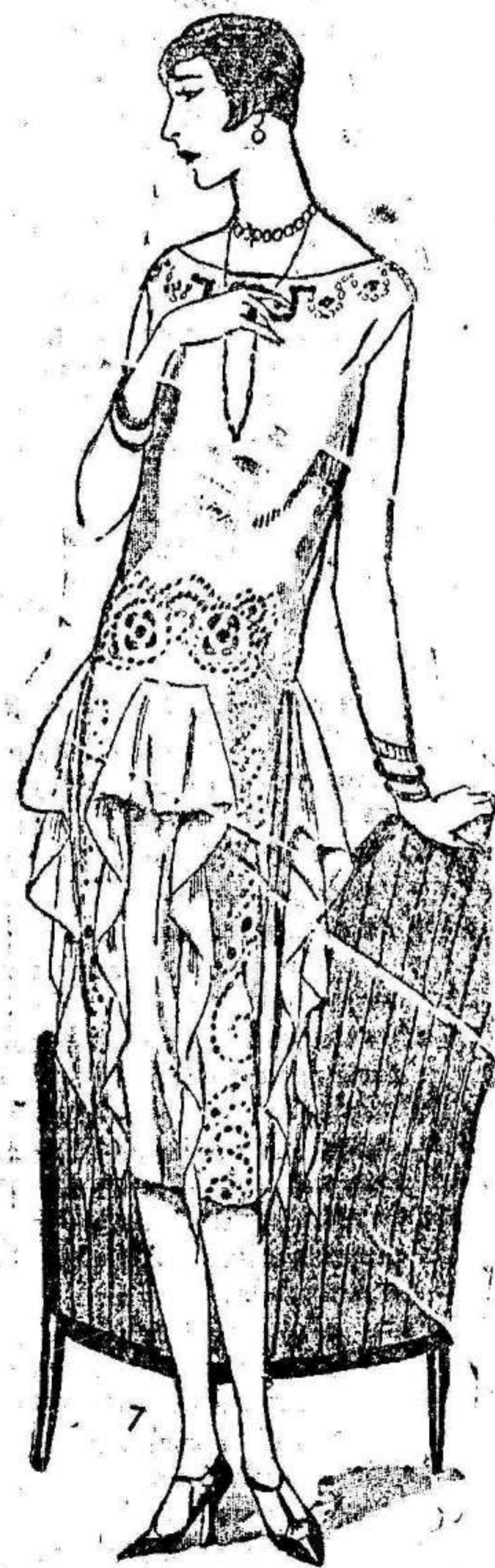
Espléndido traje de noche para señora joven

Las notas de esta admirable página musical, henchida de exaltado patriotismo, unglida de melodiosas cadencias en las que vibra toda la jugosa inspiración de una madre española, la ilustrada compositora señora Palmer de Ma-