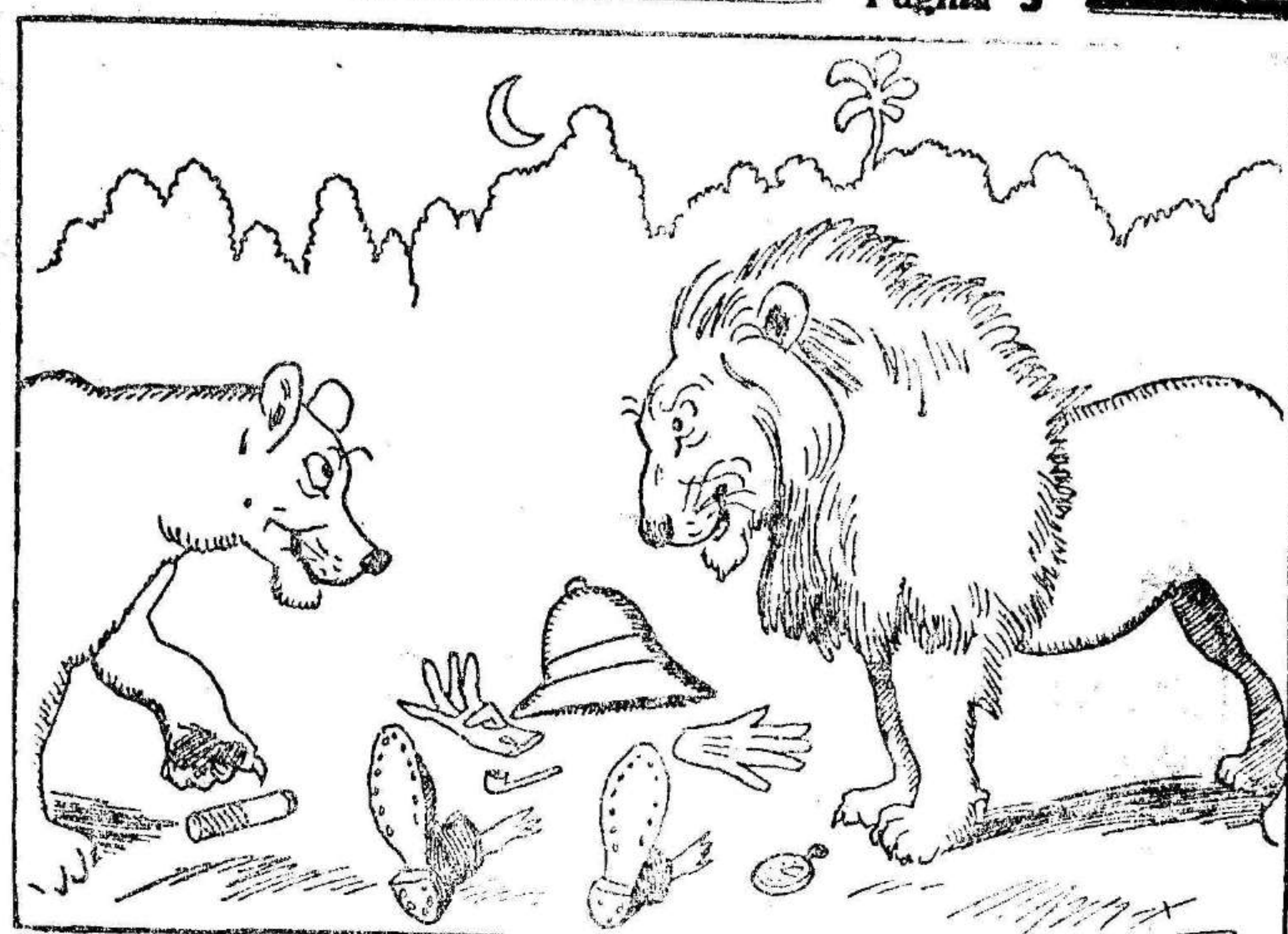
El león.—¡Chical! ¿Sabes que me ha sentado muy bien? Se me ha quitado el dolor de cabeza. La leona.—¡Clare! Como que acababa de tomarse dos tabletas de aspirina Bayer.

Madrid.—Con asistencia de varios generales y gran número de compañe-