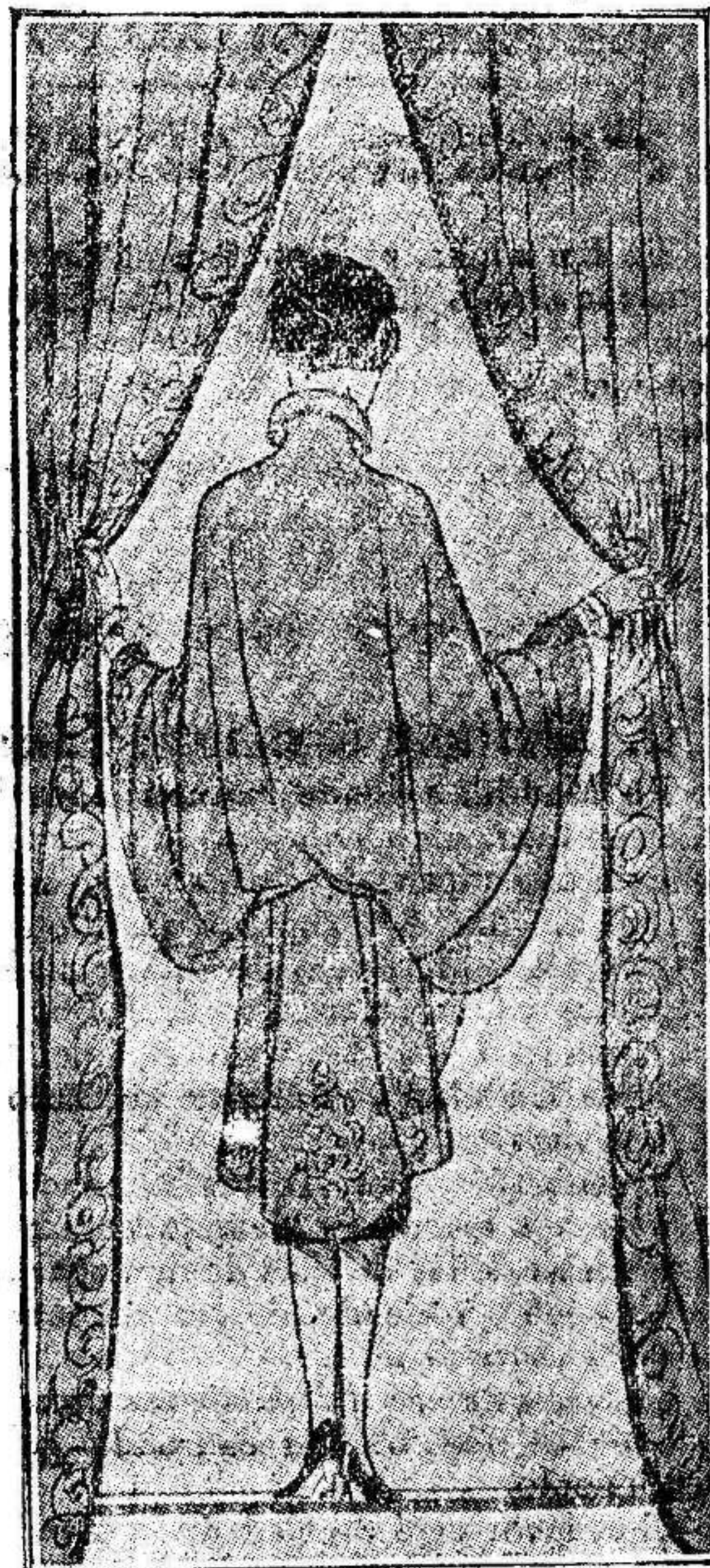
Elegantísimo abrigo de noche

Las fiestas de Pascua, representan para París una temporada de sucesivos encantos, para todo cuanto a la Gran MODA se refiere. ¡Es cuando los grandes Modistos, lanzan sus mejores trajes y sus más sugestivas toilettes para las reuniones de tarde y noche. Es cuando las elegantes se reservan el estreno de las toilettes separacionales y de más efecto NOEL!!!. Una de las fiestas que más se celebran en Francia y que representan más ingresos para las casas donde expenden y crean, los