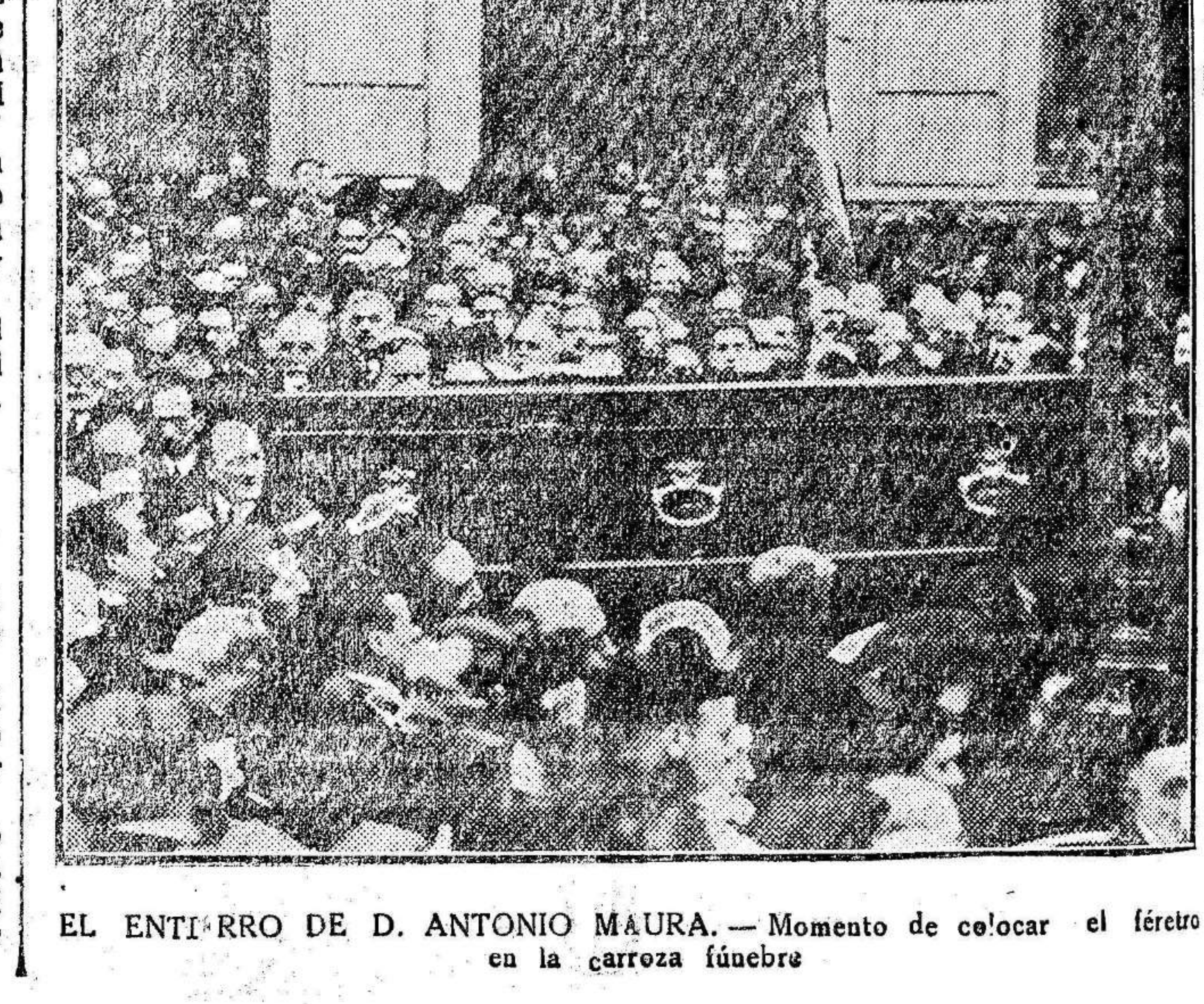
EL ENTERRRO DE D. ANTONIO MAURA.—Momento de colocar el féretro en la carroza fúnebre