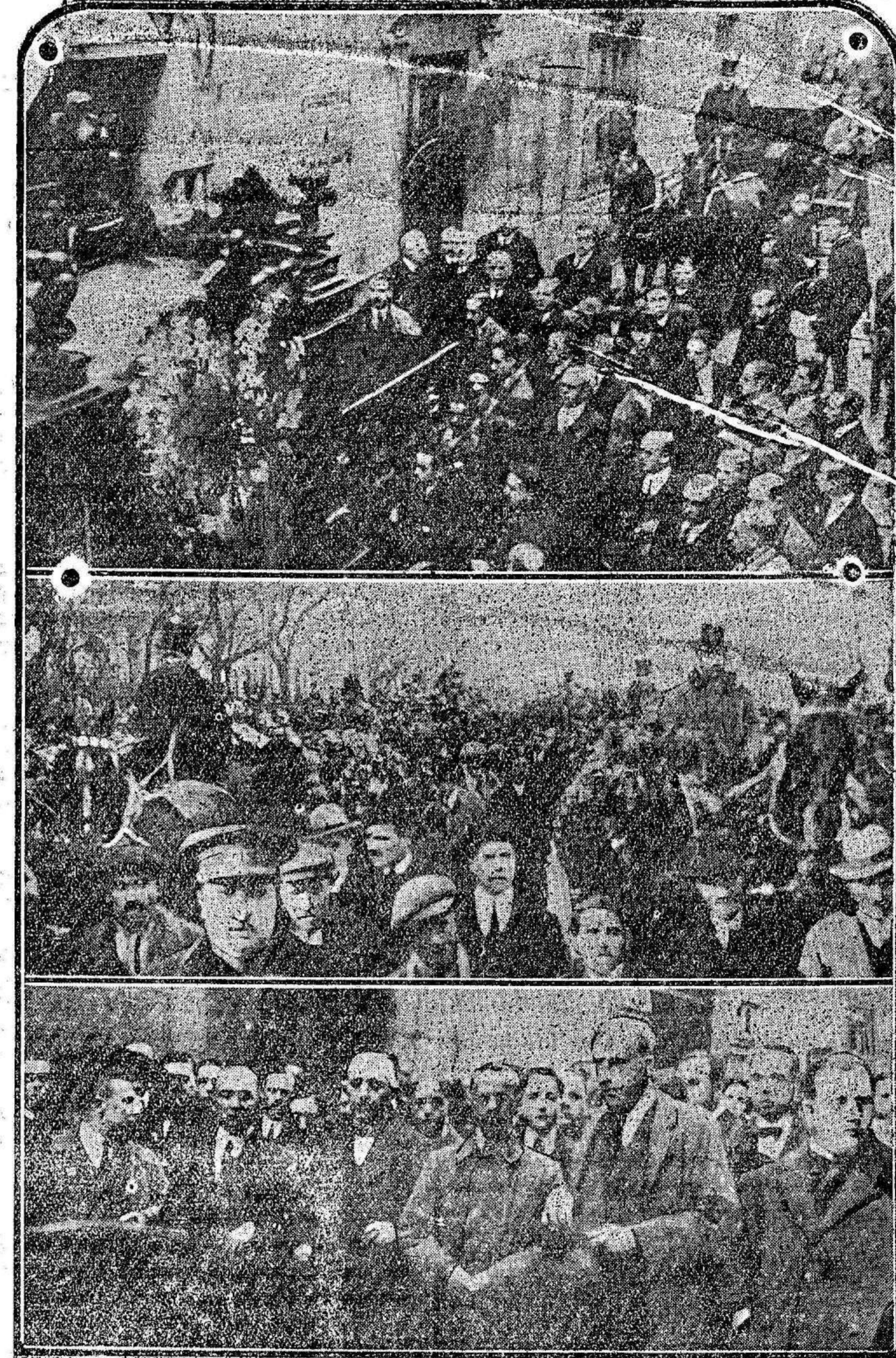
Momento de ser sacado el féretro de la Casa del Pueblo a hombros de los miembros de la Juventud Socialista.—En el centro desfile de los treinta y ocho coches que precedían al cadáver portando las coronas que fueron recibidas.—Abajo, la presidencia del duelo