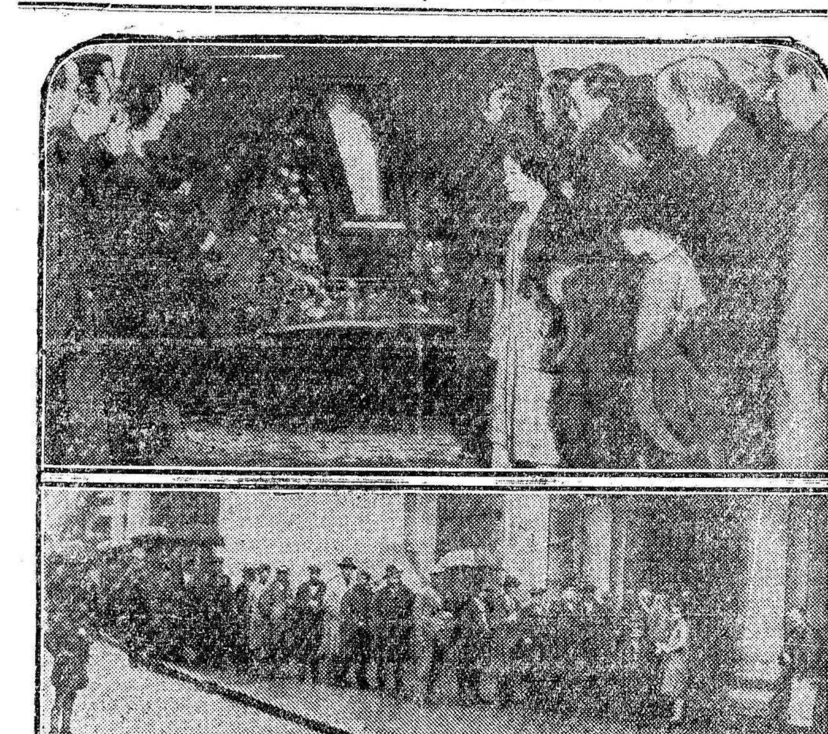
Arriba: El cadáver de Pablo Iglesias expuesto al público en la capilla ardiente de la Casa del Pueblo. Abajo: La interminable fila de admiradores del maestro del socialismo esperando a la puerta de la Casa del Pueblo para rendir al «abuelo» el ultimo tributo