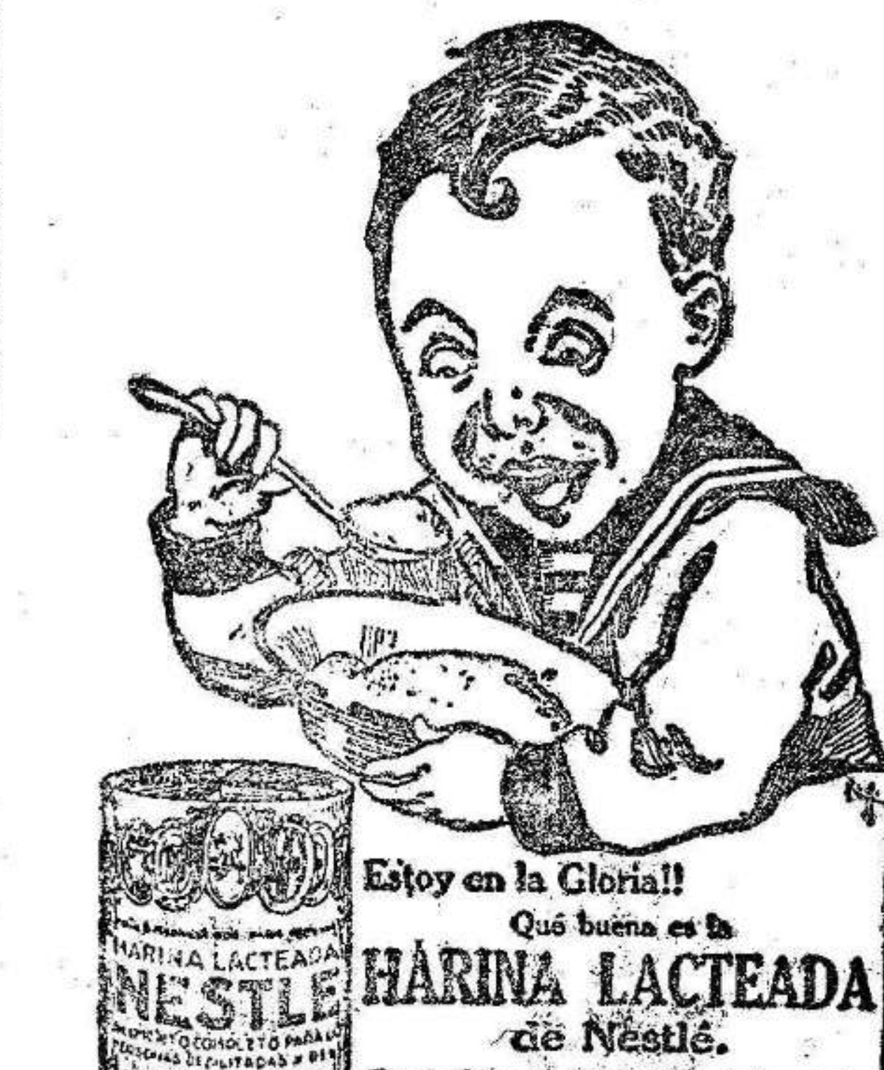
Estoy en la Gloria! Que buena es la HARINA LACTEADA de Nestlé. Es el alimento que prefieren los niños.

En Almería: kiosco Madrileño. En Baza: kiosco de la Paz. En Loja: kiosco de la Paz.