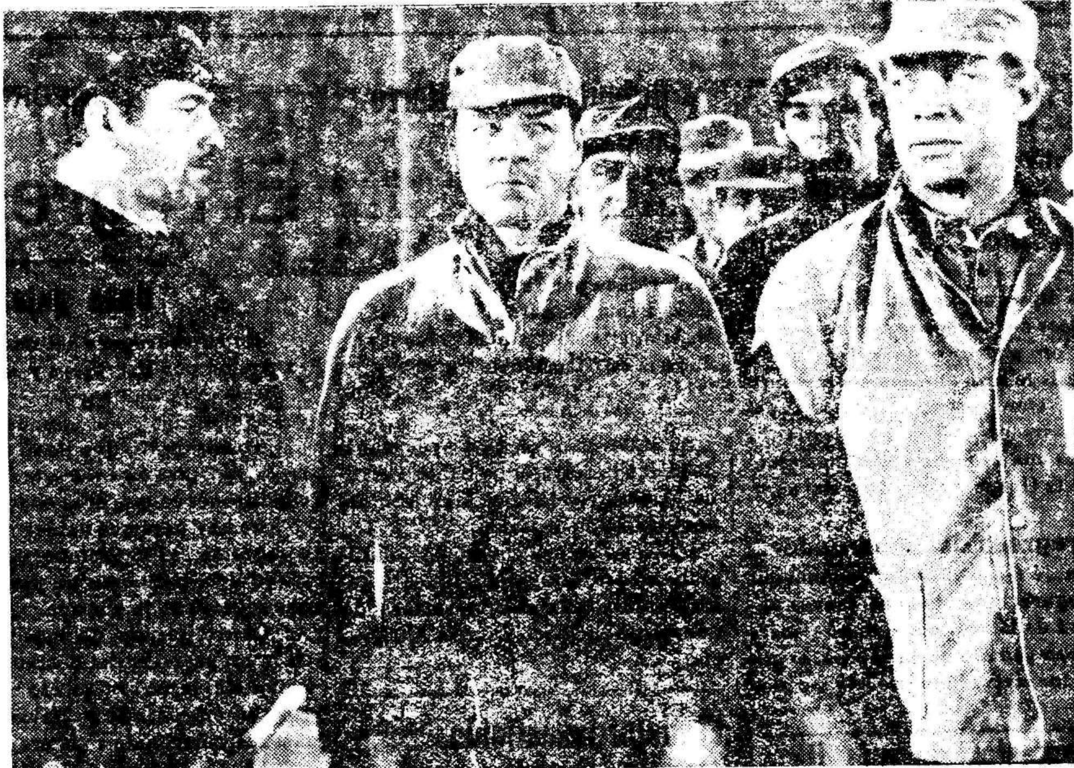
Uno de los momentos de la producción Columbia EL REMOLINO que Cifesa nos presentará en breve

Ultimamente ha protagonizado con la simpática y sugestiva Anna May Wong la película «Chu Chin Chow» habiendo en ésta conseguido su más grande éxito conocido hasta la fecha el cual lo ha superado con la protagonización que hace de su «rol» de Sultán en la película «Abdul Hamid» (El sultán maldito) que para la próxima temporada prepara Cifesa. La crítica londinense dice del trabajo que Fritz Kortner hace en esta película de la B. I. P. que no es posible ni siquiera una mayor caracterización ni dar a un personaje de psicología tan compleja una más humana expresión como la que él logra.