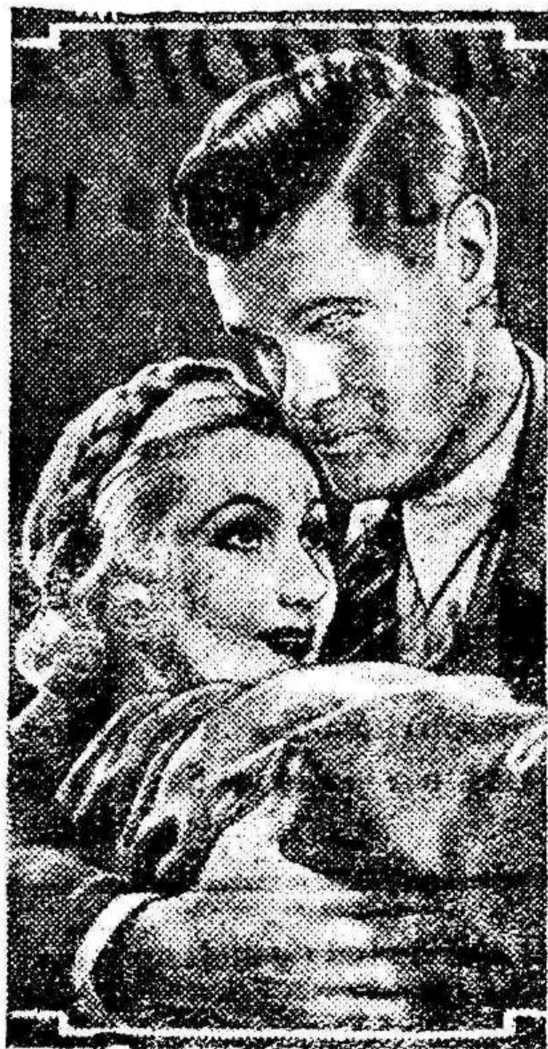
Una escena del film Cifesa CITA A CIEGAS