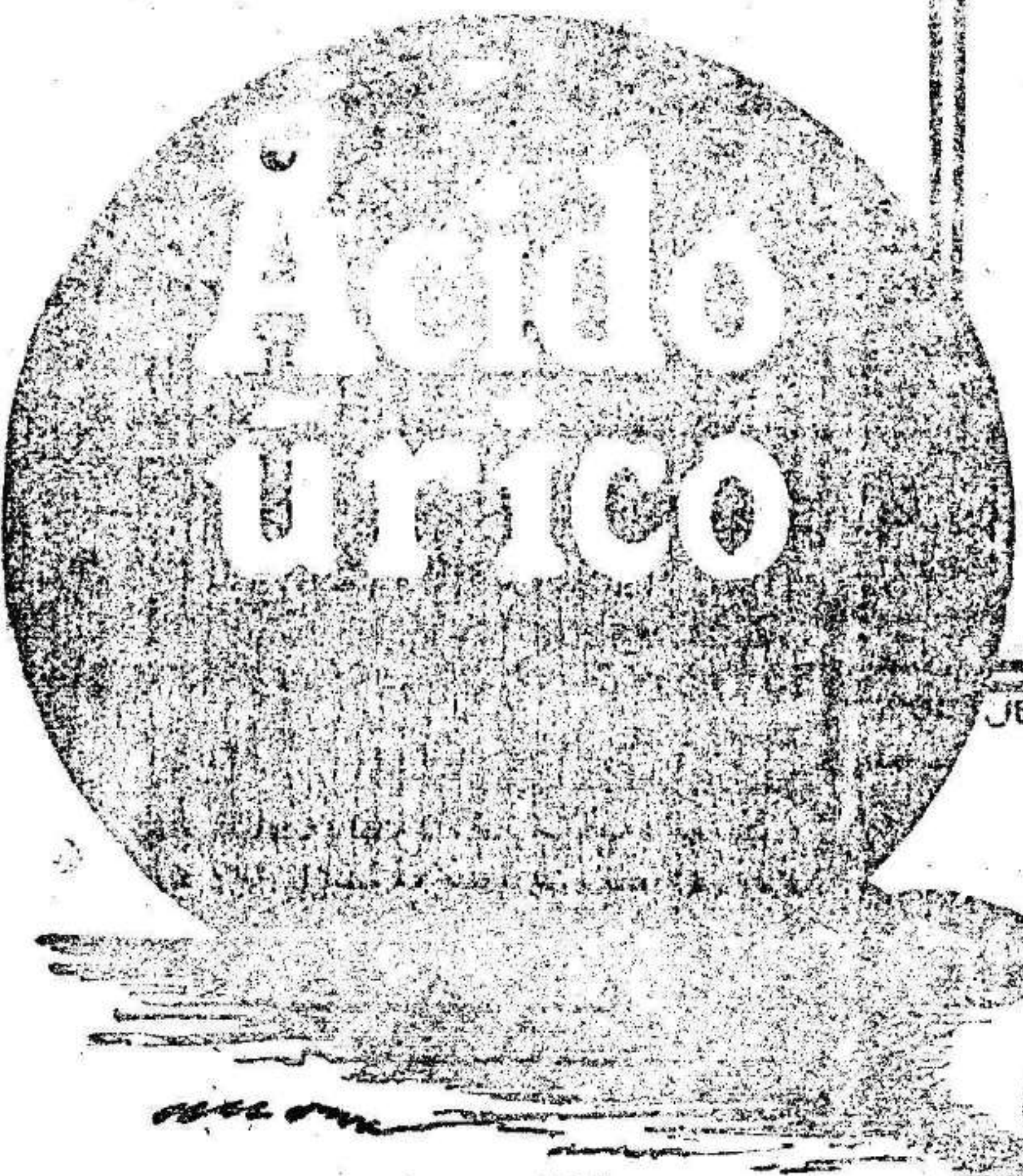
Depositarío único para España, DALMAU OLIVERES, 14, Paseo de la Industria, BARCELONA y en todas las buenas farmacias y almacenes.

Agencia de Encargos de Murcia y Lora de Francisco López García —SERVICIO DIARIO— A DOMICILIO Casa central en Murcia: Pascual, 17 (antes Con traste). —En Lora: Cana lejas, 84 (antes Corredera.