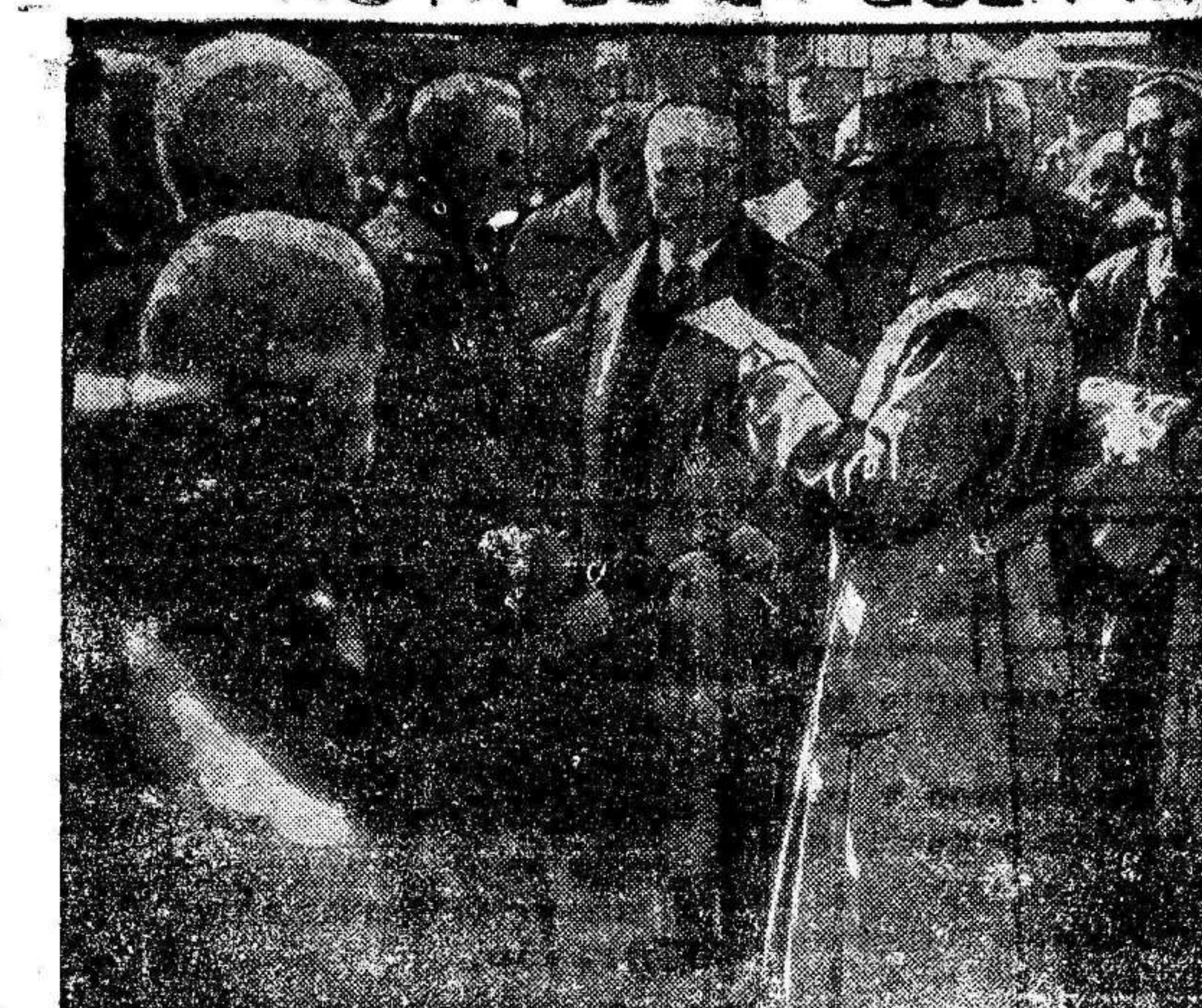
Mr. Poincaré acompañado del ministro de la Guerra y del del interior entrega una cruz al alcalde de Noyon.