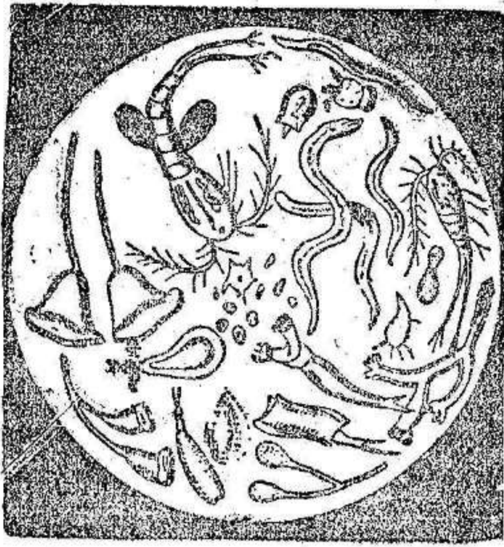
MICROBIOS destruidos por el Alquirtrán-Guyot

Así, pues, estimado señor, opino que su remedio es el mejor, pues en poco tiempo no sólo alivia el mal físico sino que también levanta el ánimo. Ojalá mi ejemplo sirva para que las personas enfermas de los bronquios lo imiten cuanto antes, pues seguro estoy de que no se arrepentirán de ello. Con las más expresivas gracias reciba, señor, mi saludo respetuoso. Firmado: X..., en Landerneau.