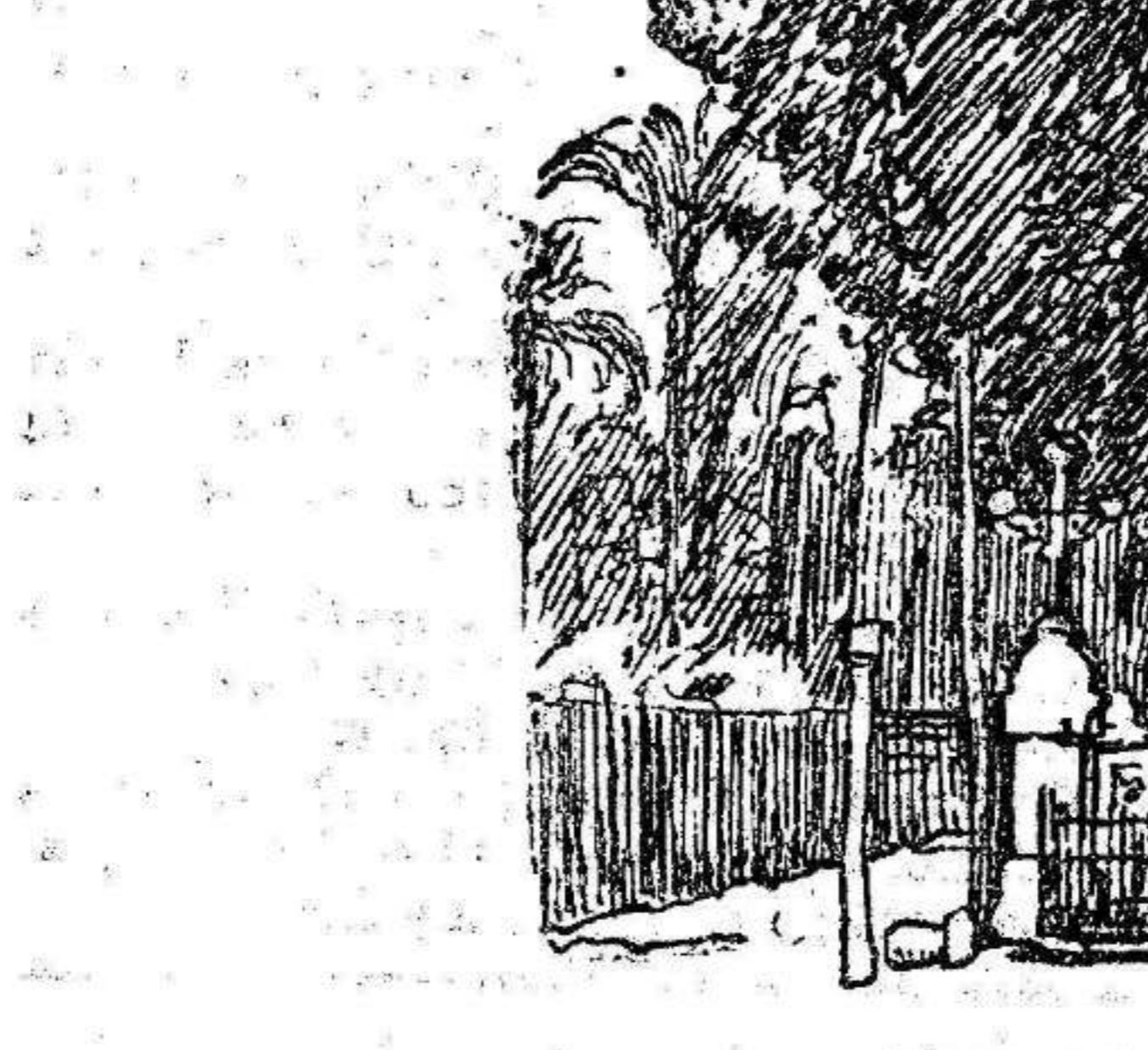
ELCHE.—Paseo frente a la estación por donde cruzó el rey.

Esta importante sociedad ha repartido esta mañana a las diez el importe de los quinientos bonos en metálico distribuidos en el día de ayer entre la clase necesitada de esta población. Es un número muy elogiado por el pueblo. El pago se