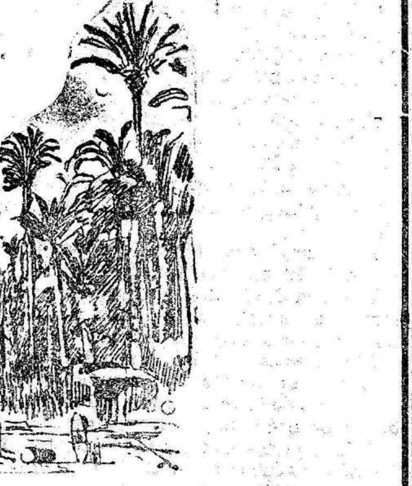
ELCHE.—La palmera del cura Castañe.

El recibimiento ha sido entusiasta. Por vez a D. Alfonso había gran curiosidad, hasta el punto de que las palmeras estaban cubiertas de racimos de hombres. El coche del rey ha sido en Elche rodeado de policía secreta y de una escolta de guardia civil. Un distinguido periodista madrileño, al ver el número considerable de niños provistos de palmas blancas ha hecho este comentario: «Este es el domingo de ramos de Villaverde; pronto vendrá a la semana de pasión.»