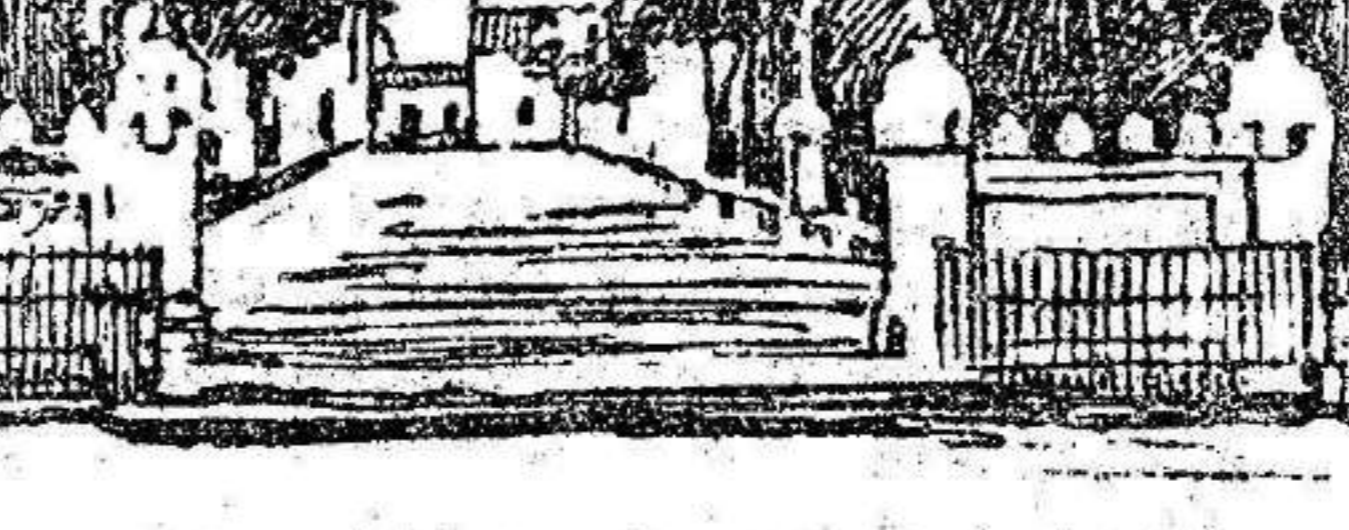
ELCHE.—Paseo frente a la estación por donde cruzó el rey.

A las dos y cuarenta minutos llega el rey. Al aparecer el tren se han disparado 21 cañonazos.