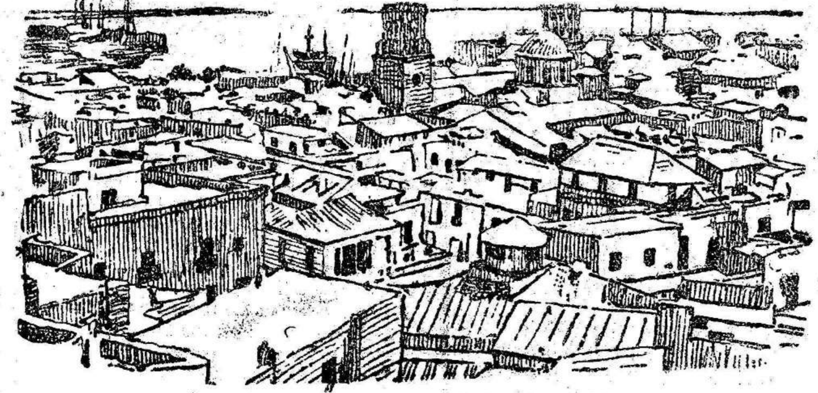
ALICANTE.—Vista del puerto.

Multitud de cigarreras le esperaban en los talleres. Fué espléndido. El rey hizo una rápida visita a la fábrica de tabacos, que no ha correspondido al interés y al detenimiento con que los obreros han estado preparando el recibimiento. Este modo de hacer visitas no satisface a los que durante muchos días se