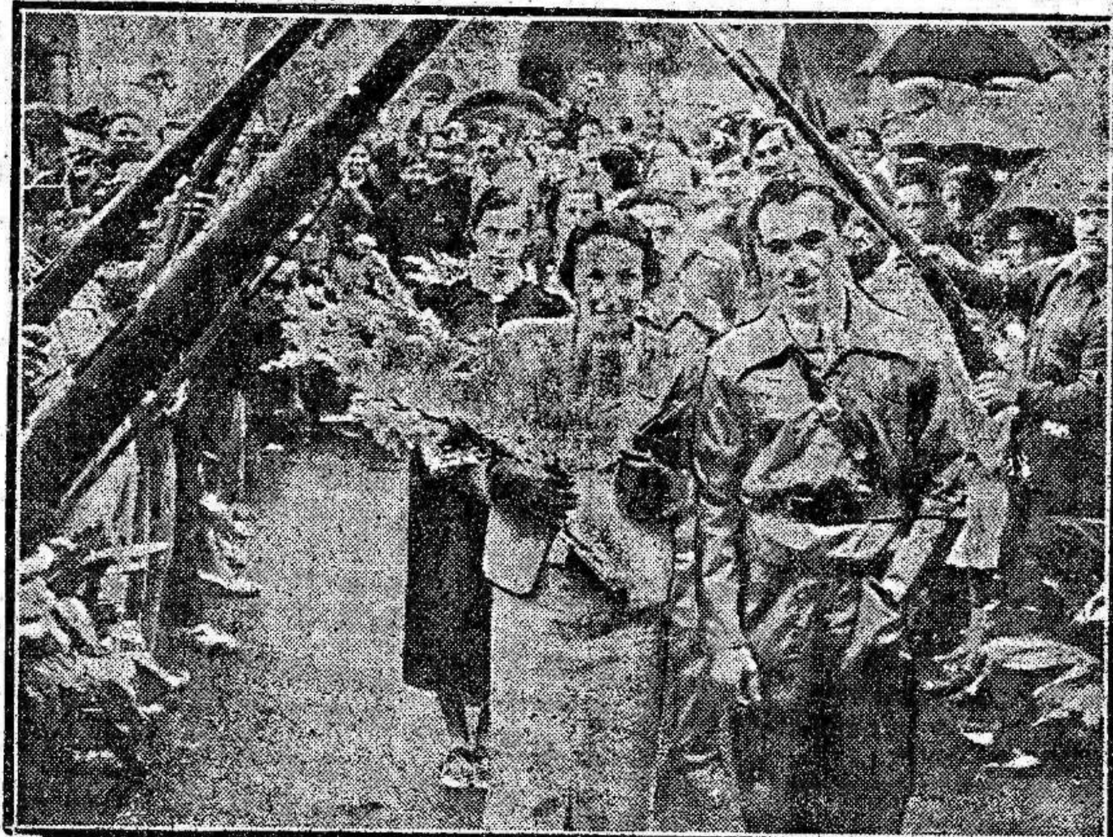
Una boda—tan en boga—de un miliciano con una muchacha del pueblo. La pareja pasa bajo el arco triunfal que forman los fusiles aún no ensfriados.