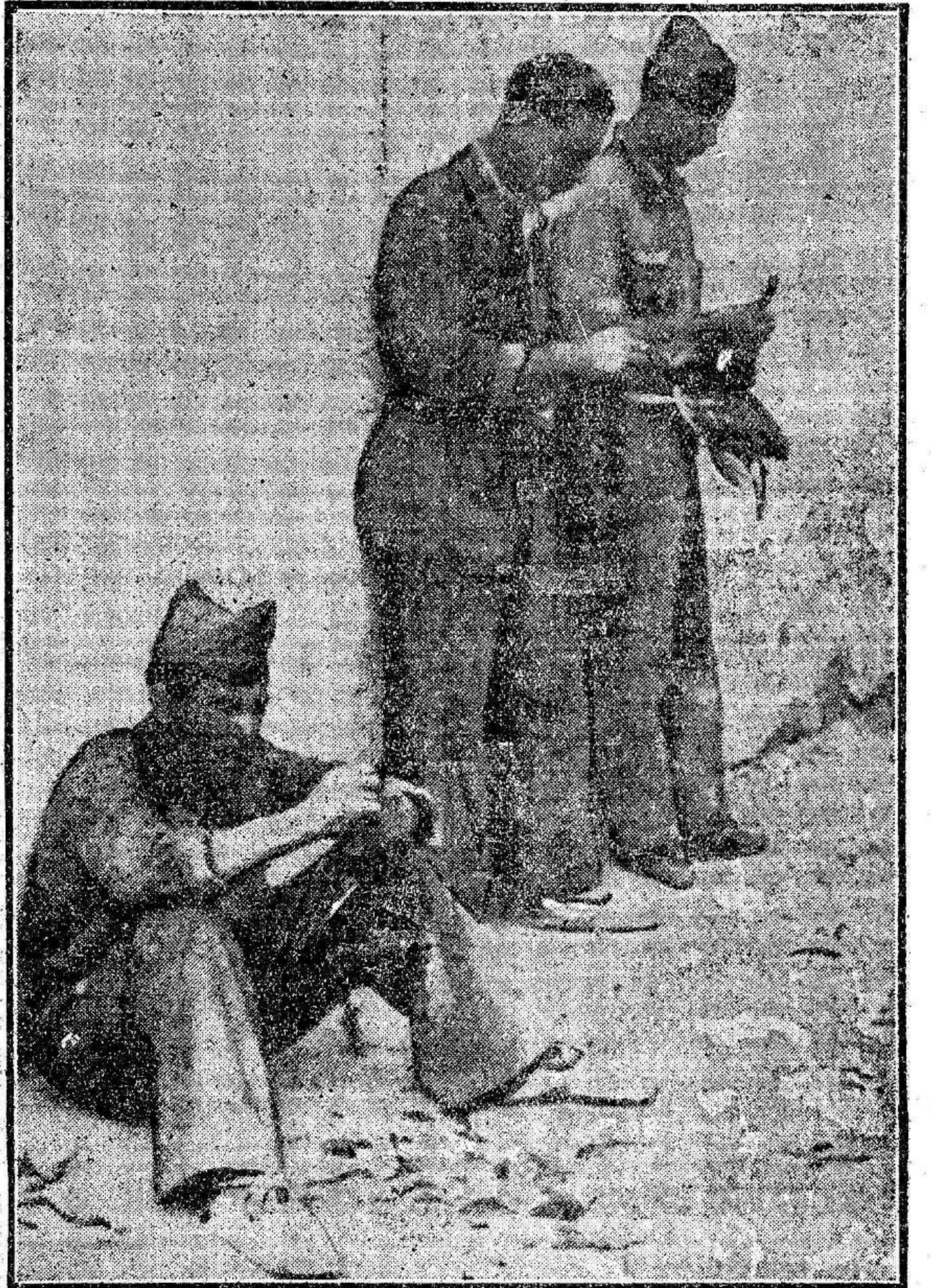
Estos milicianos, dejan por unos momentos el fusil, para dedicarlos al desplum de unas gallinas que han de servir para reparar fuerzas