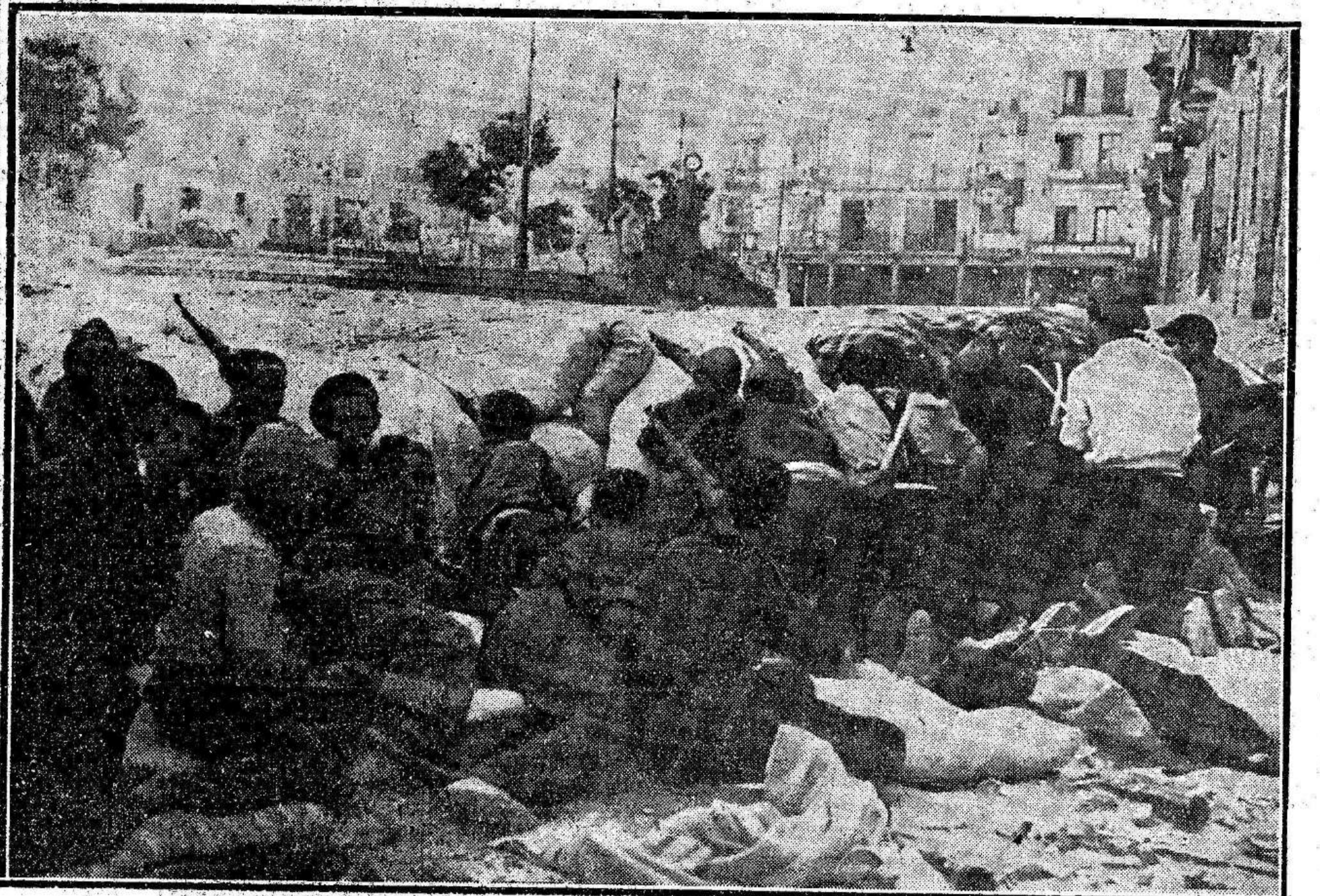
TOLEDO.—Un grupo de fuerzas leales ataca desde una barricada a los rebeldes concentrados en el Alcázar

Relación leída ante el micrófono del ministerio de la Guerra a las veintidós. Continúan en todos los frentes enconadas luchas, las cuales el enemigo está recibiendo serias derrotas.