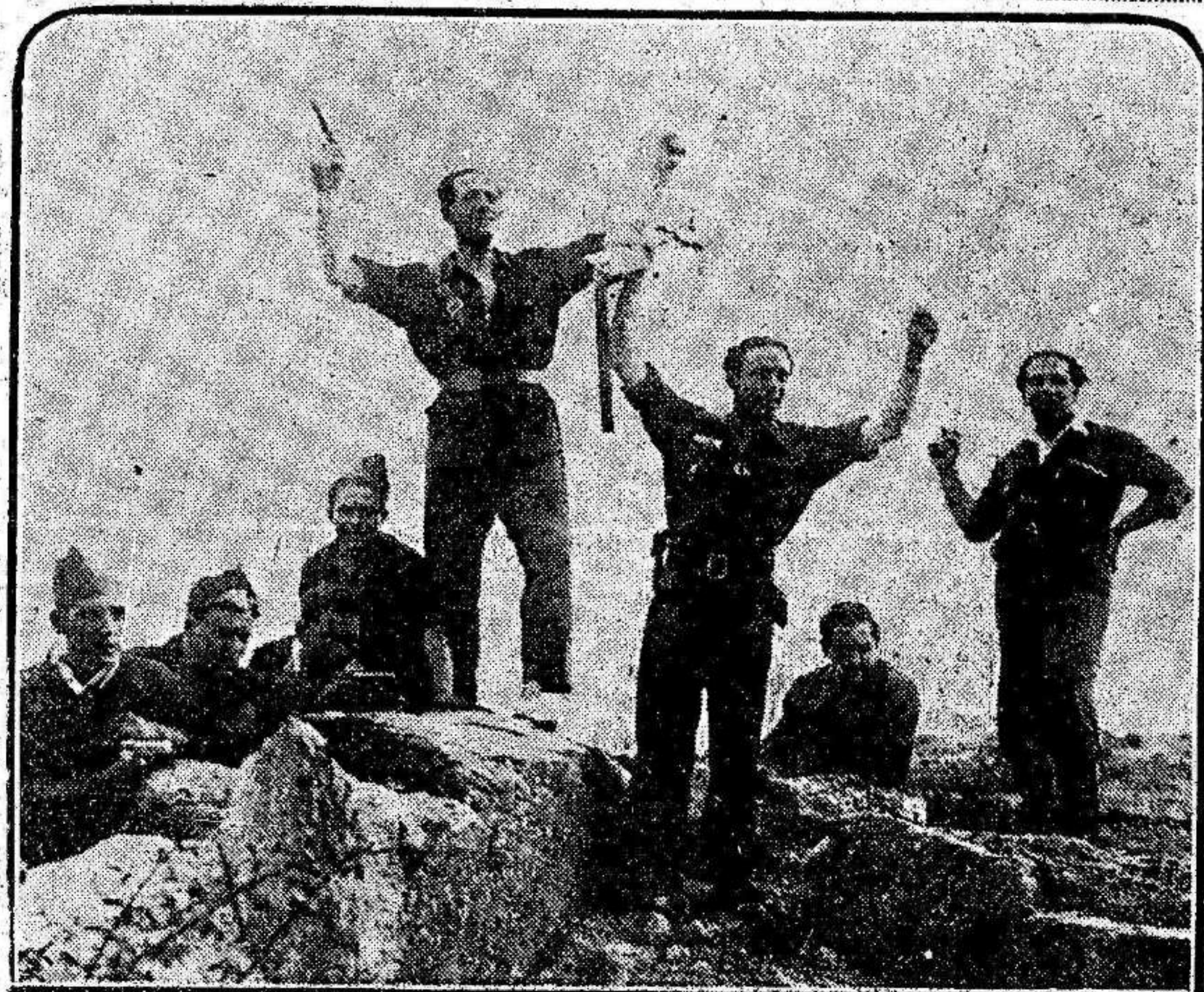
Los "Franyanos" y su escolta, después de tomar las cumbres de Peguerinos

Nuestra aviación salió en persecución del sedicioso, que fué abatido.—Febus.