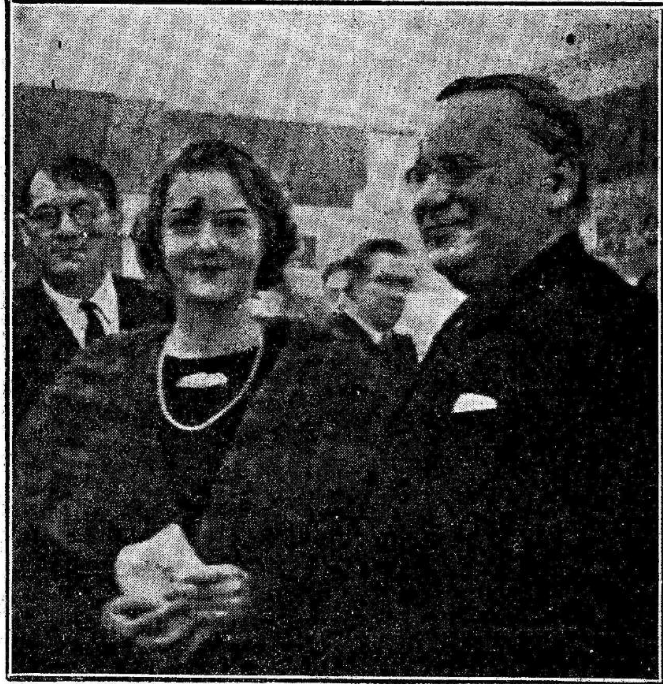
Litvinof, uno de los valores más representativos de la democracia rusa, demuestra a la bella "star" del cine, Mary Glory, con su más alegre sonrisa, que la galantería y las buenas formas son características predominantes en los hombres de la III Internacional.