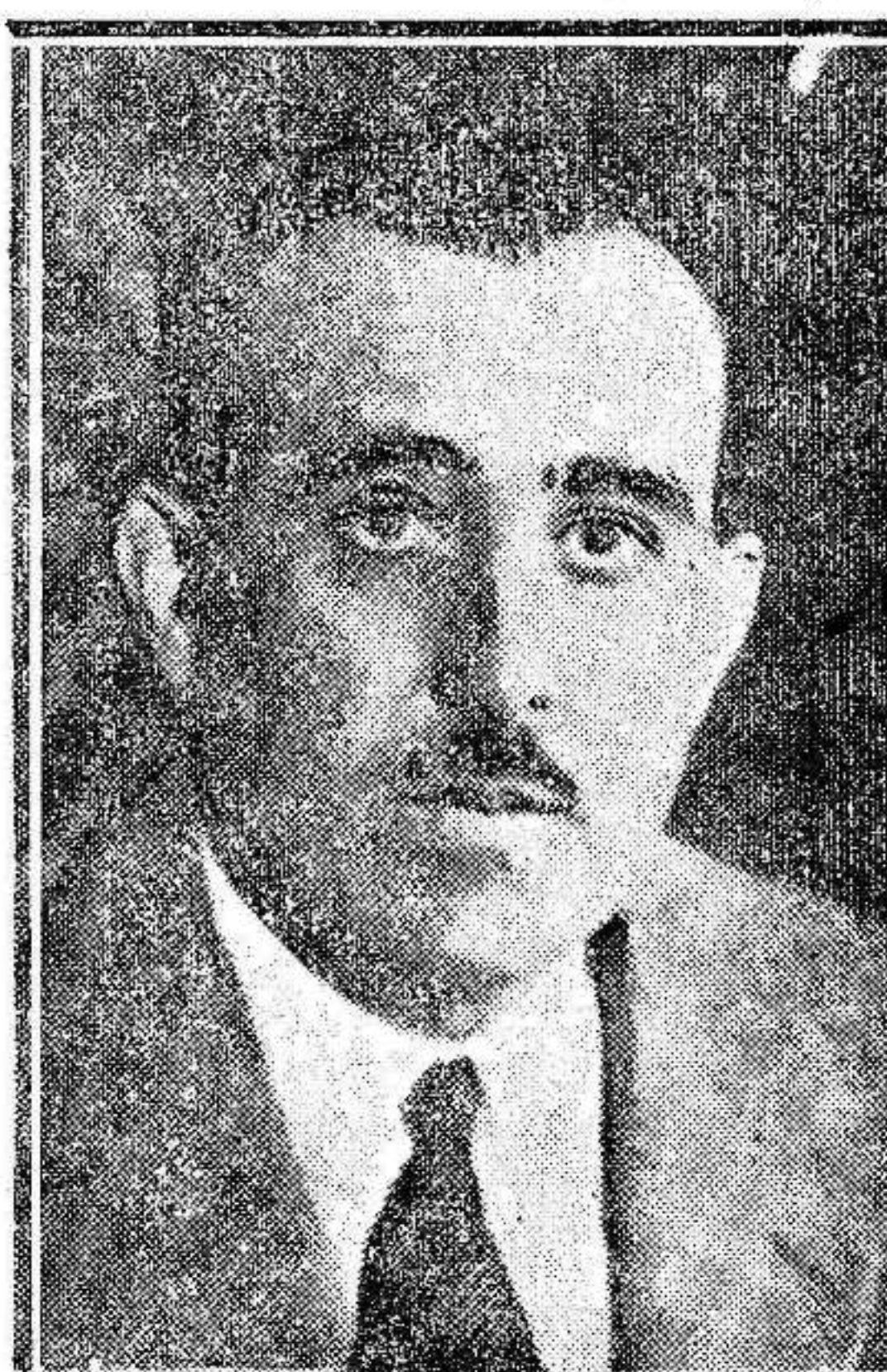
El ministro de Agricultura señor Alvarez Mendizábal

—En efecto, confidentes de la Dirección de la Guardia civil y del ministerio de la Guerra hicieron llegar a conocimiento del Gobierno reuniones clandestinas en Zaragoza, Madrid, y alguna otra provincia de jefes y oficiales del Ejército. Se tomaron, naturalmente, las medidas necesarias y si se llegó a saber algo, pero de infinita importancia. Yo, por mi parte, le dije al Sr. Portela: "Mire usted, yo, durante la dictadura he estado presente en todas cuantas conspiraciones se fraguaron en aquella época y puedo decirle que ninguno de los militares comprometidos acudieron nunca a cumplir su palabra. Sigo creyendo que ahora pasa lo mismo. Es más de temer la reunión de un grupo de camareros o de cocineras, que al fin y al cabo representan algunas fuerzas, pero en cambio militares que se comprometan para estas cosas, no creo en su eficacia. Desde luego, yo estoy convencido de que el Ejército, como entidad, es siempre leal al Poder constituido. Con este régimen o con otro cualquiera, y que sólo un reducido número de descontentos que existen en todas partes, son los que promueven estos pequeños focos que pueden reducirse sin el menor esfuerzo."