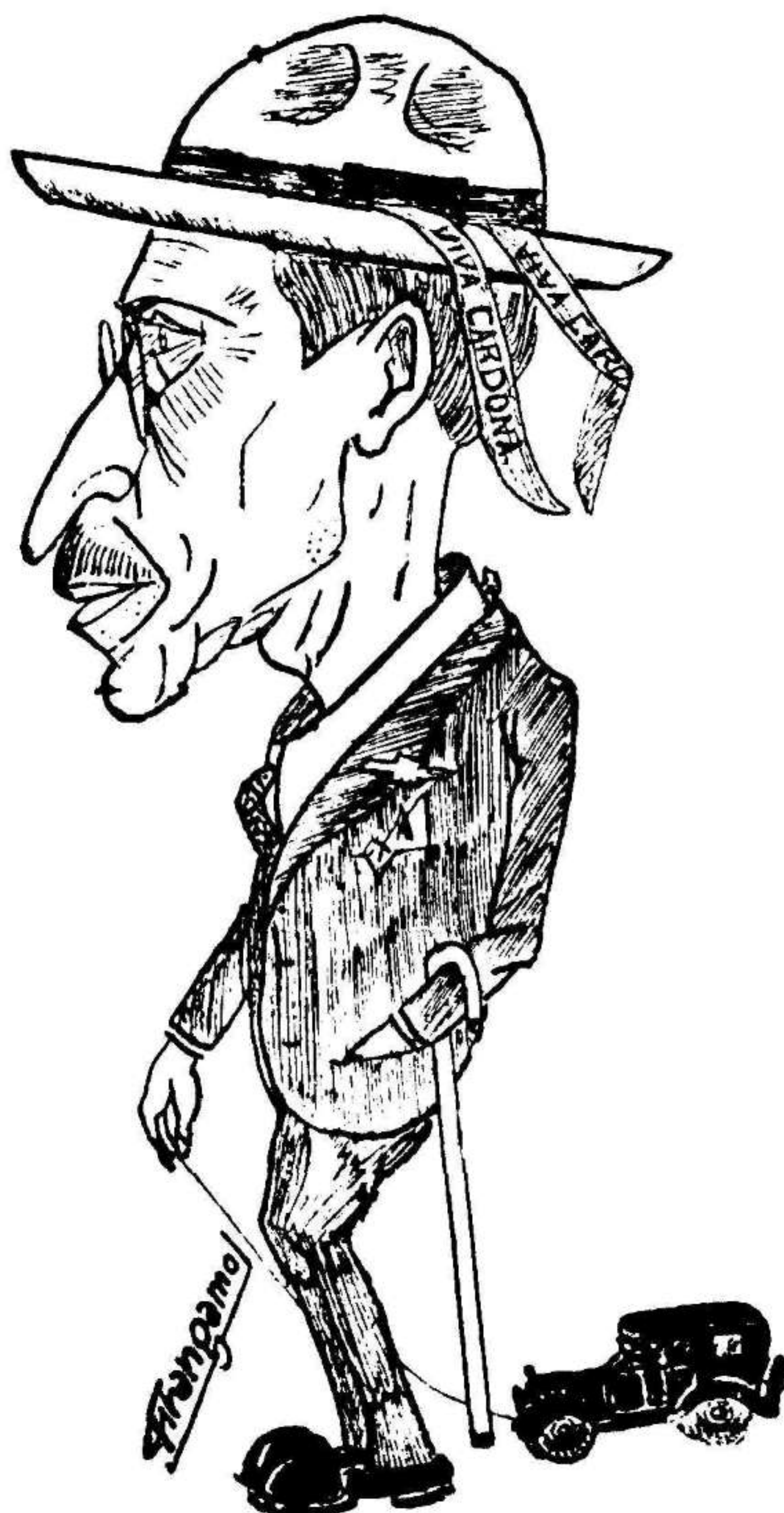
«EL NIÑO DEL CHEVROLET»