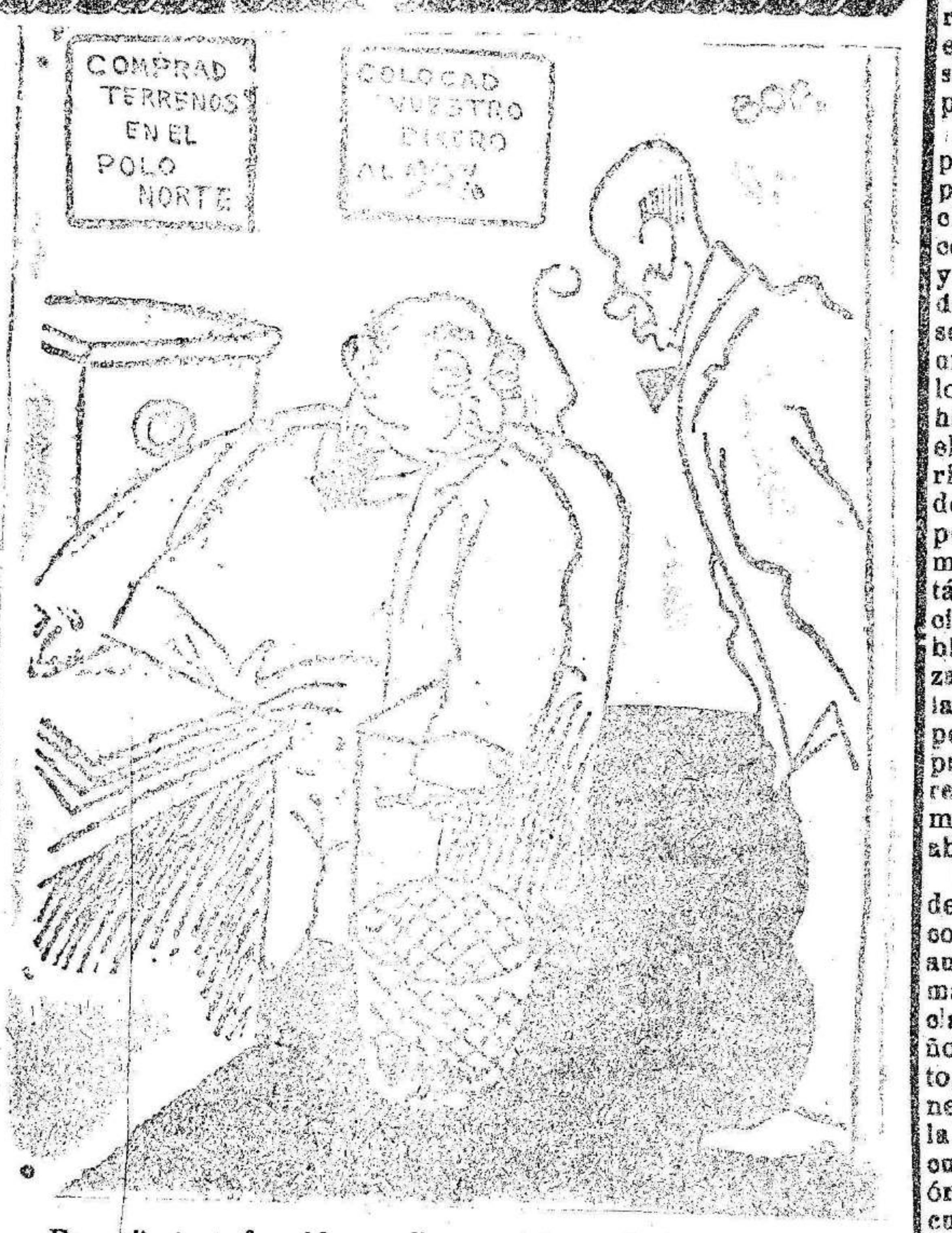
—Es un cliente enfurecido que dice que viene a usted un par de bofetadas. —Pues légal y dígame que recibo los martes nada más.