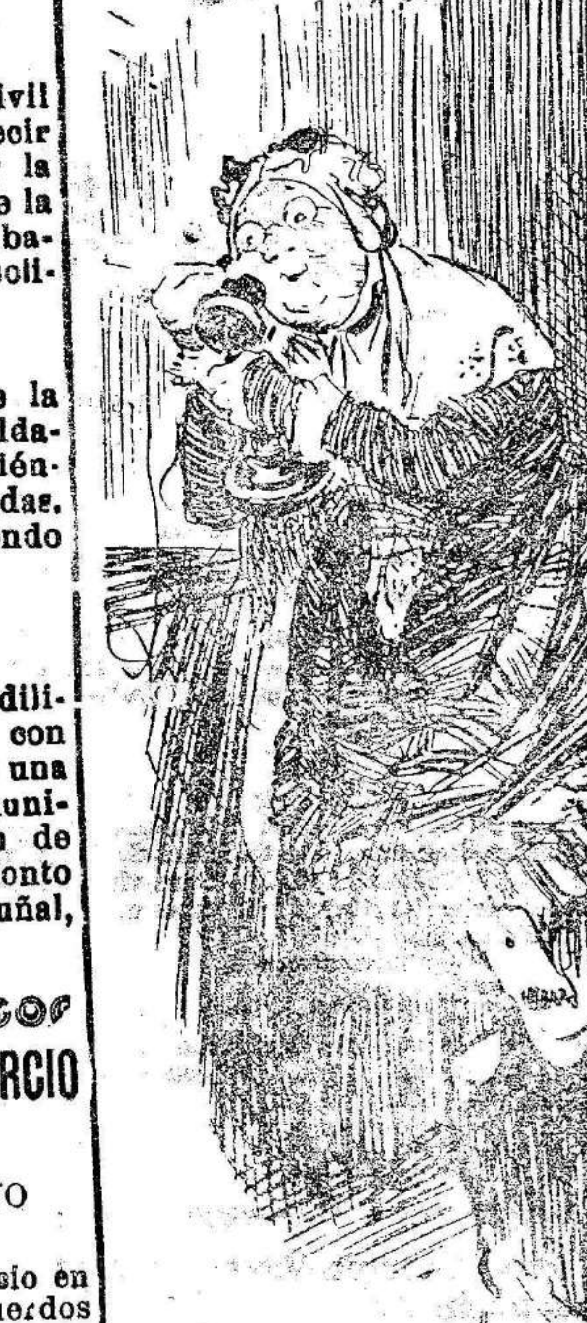
LA SEÑORA VIEJA AL TELEFONO.—¿Es el 10 005? Yo quería el 10.904. No importa; como será la casa de al lado, quiere ir a avisarles que yo saldré con mi nieta esta noche y no estaré en casa?

La Policía detuvo anoche a un extremista, el cual se ha negado a facilitar las señas de su domicilio.