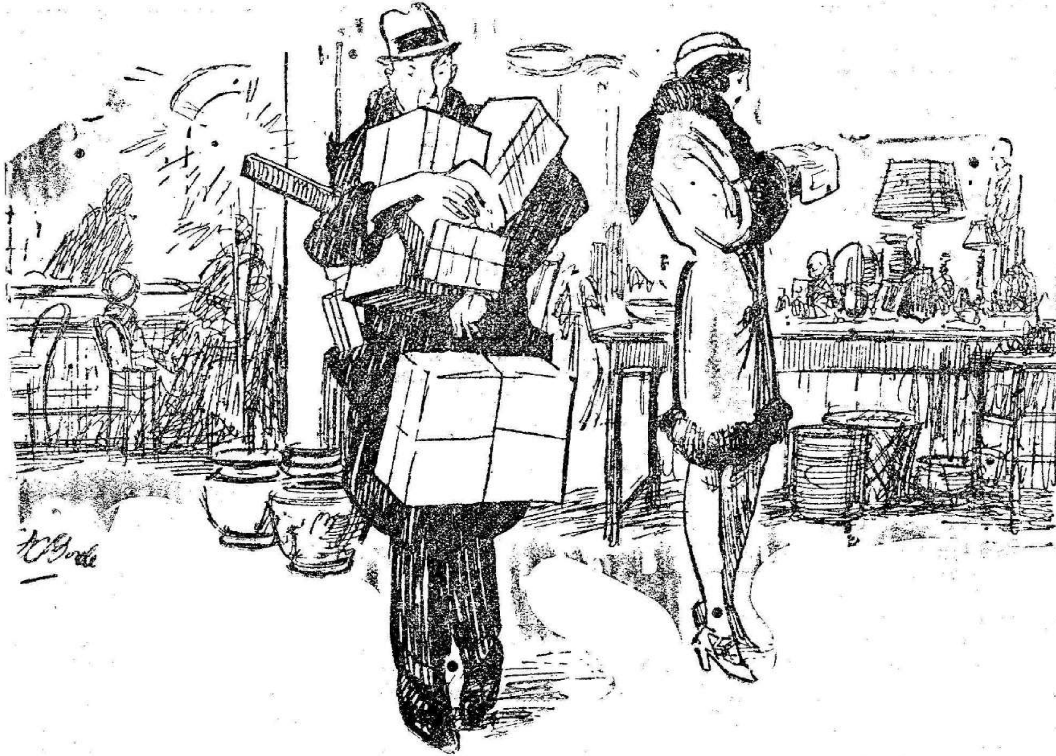
LA MUJER COMPRA JUGUETES Y LOS LLEVA EL MARIDO