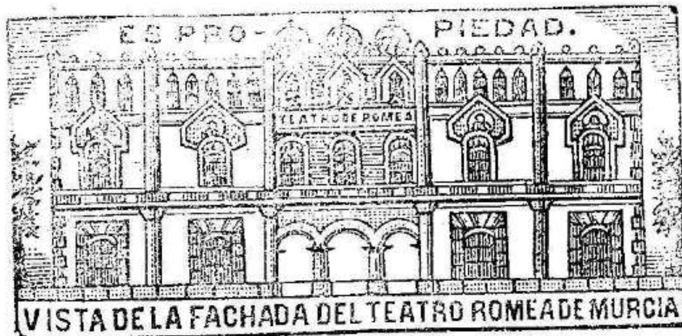
VISTA DE LA FACHADA DEL TEATRO ROMEA DE MURCIA. Este papel se vende más caro que otros: no está premiado en exposiciones, sino por el público que lo consume mucho.