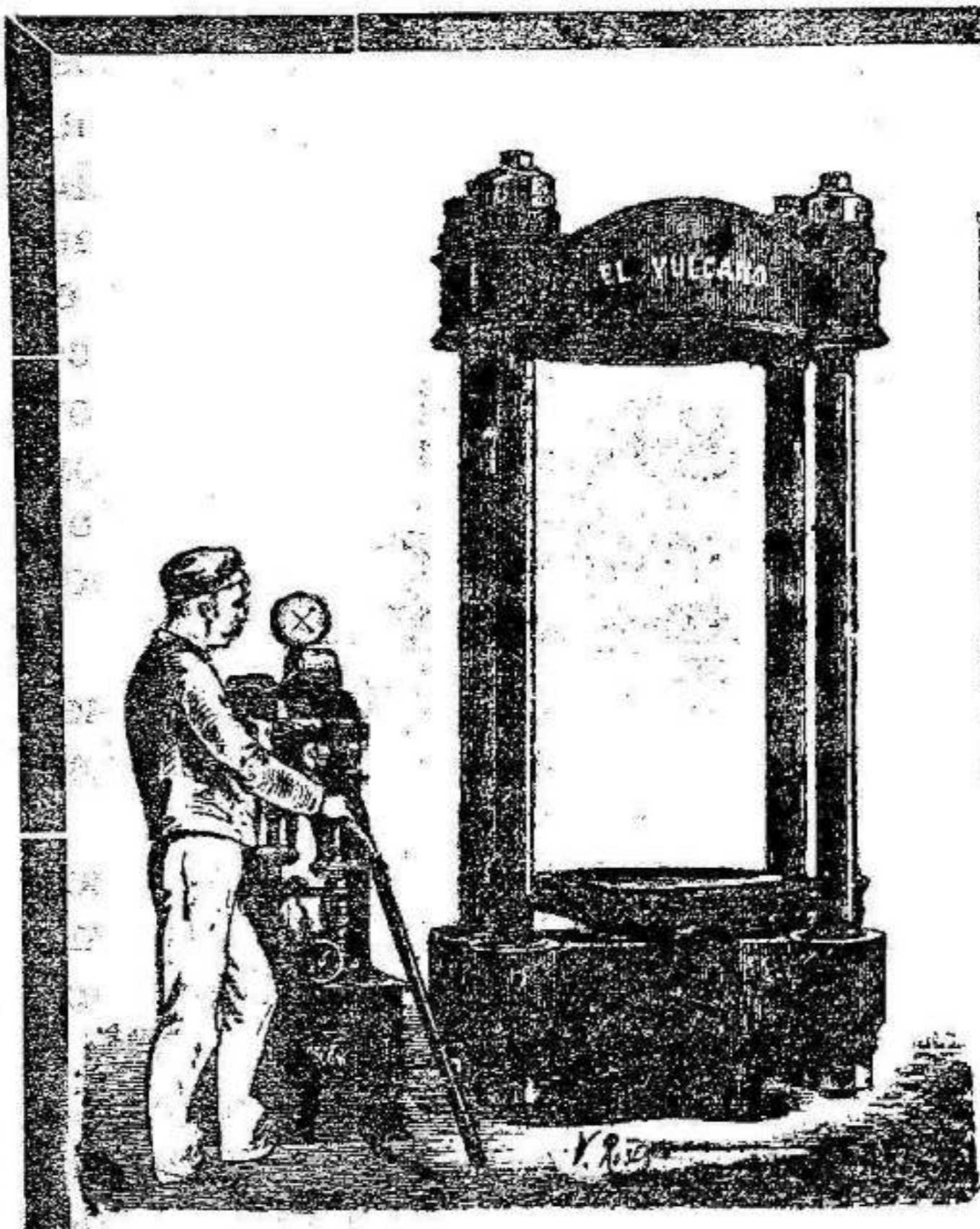
Oficinas: P. Pelota, 6. Talleres: C. Orilla del Rio, 16