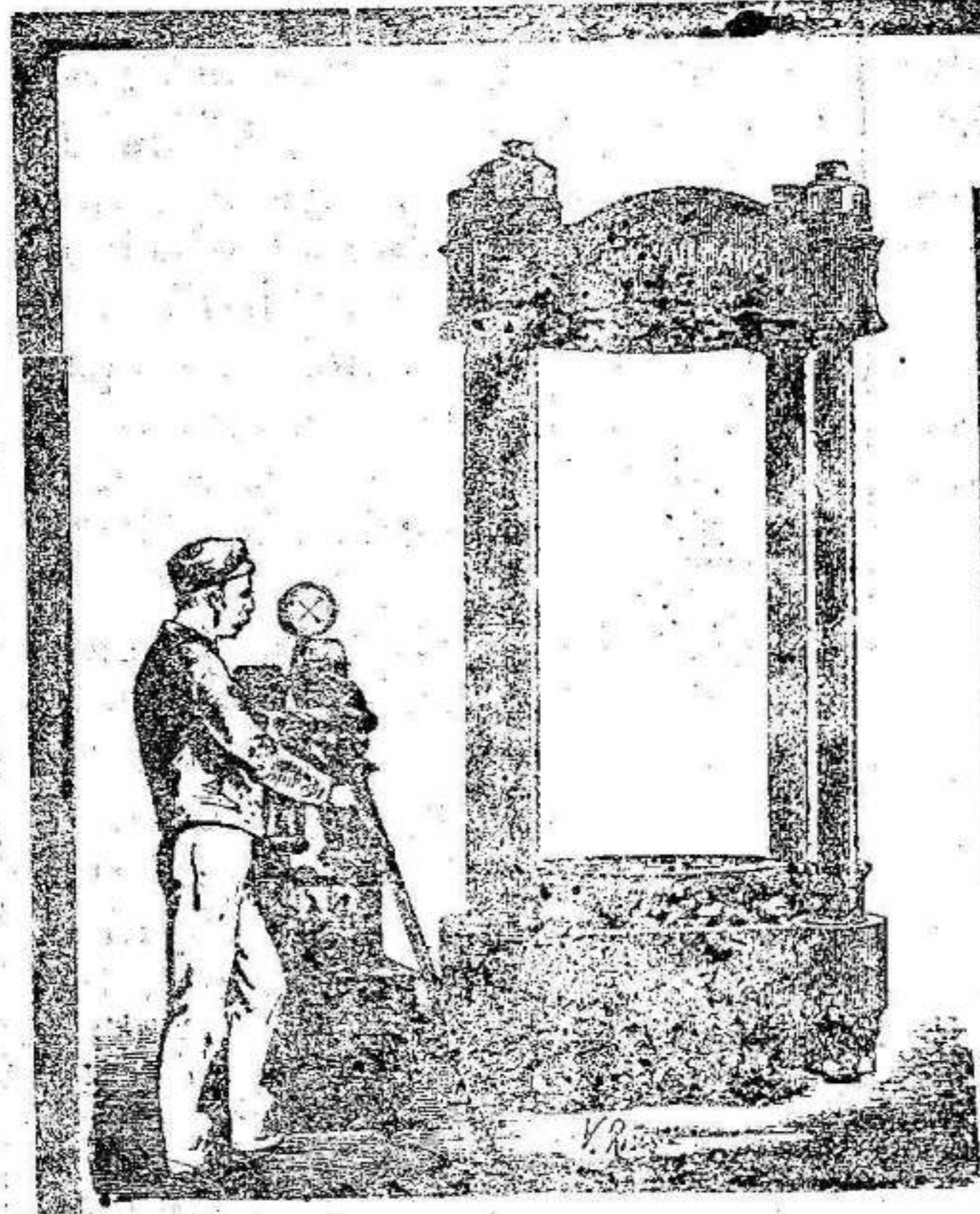
Oficinas: P. Pelate, 6 Talleres: D. Juan del Rio, 16

Cuatro reales frasco, en todas las farmacias y droguerías, en Murcia, farmacia de Pino y Vivo, Principe Alfonso, 1. 10—7